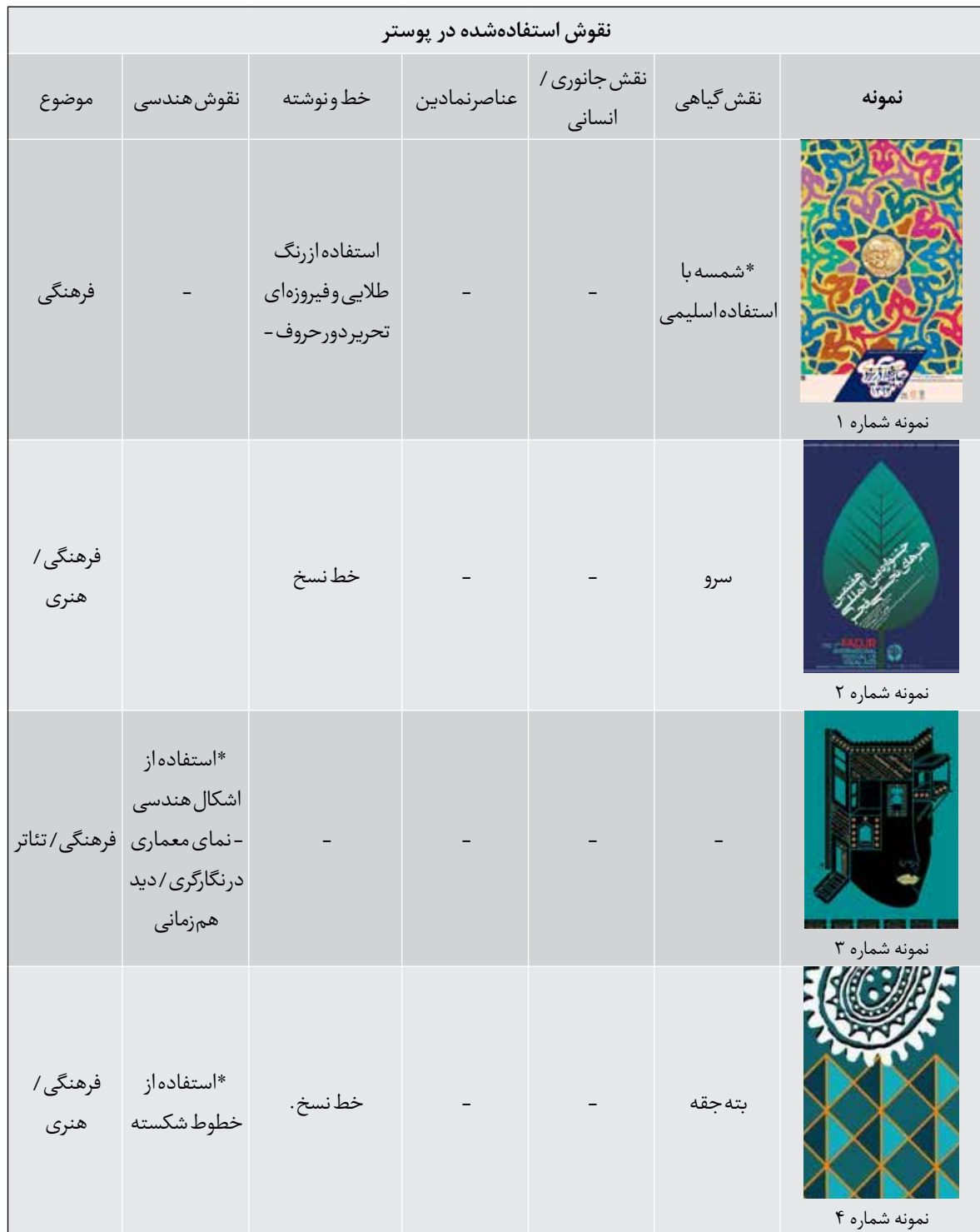
جدول ۱: نوع نقوش و نحوه استفاده از عناصر نگارگری و بن‌مایه‌های نگارگری ایرانی

نمی‌کند. از دید سوسور نشانه‌ها در اصل به یکدیگر ارجاع داده می‌شوند. در درون نظام نشانه‌ای «همه چیز وابسته به روابط است. هیچ نشانه‌ای به تنهایی معنا پیدا نمی‌کند و ارزش آن به رابطه با نشانه‌های دیگر است». سوسور می‌گوید: «مفاهیم به‌گونه‌ای اثباتی و ایجابی و به موجب محتوایشان تعریف