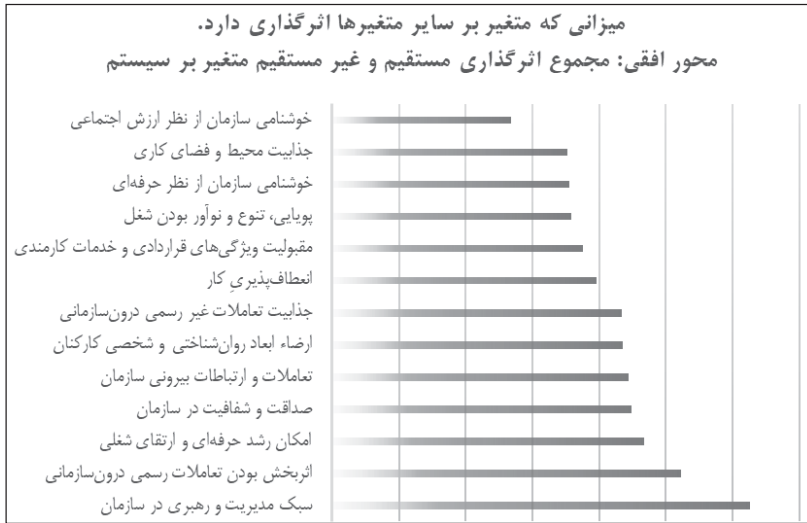
شکل ۲. ترتیب متغیرها بر اساس بیشترین اثرگذاری بر سیستم