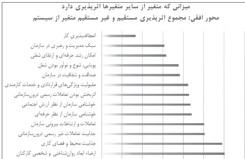
شکل ۳. ترتیب متغیرها بر اساس بیشتری اثرپذیری از سازمان

۱. عددی که جایگاه هر یک از این متغیرها را نشان می‌دهد، محصول محاسبات پیچیده نرم‌افزاری بوده و عدد مطلق آن ارزشی برای تحلیل ندارد. به همین منظور از ذکر عدد محاسبه شده برای متغیرها در این دو نمودار خودداری شده است.