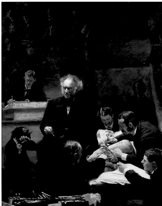
تصویر (۴): ایکینز، درمانگاه دکتر گروس، ۲۴۰ × ۱۹۵ سانتی متر، رنگ روغن روی بوم، ۱۸۷۵

این گرایش در نقاشی، در سال ۱۹۷۲ م، در داکومنتا واقع در کاسل با عنوان "هایپرئالیسم" با اندکی تفاوت در موضوع، به اوج خود رسید. "فتورئالیسم سبکی از نقاشی است که بعد از سال ۱۹۶۰ وجه عمومی یافت. به ویژه اینکه در آمریکا رخ نمود و در اروپای غربی و مخصوصاً در بریتانیا طرفداران فراوانی یافت. در سال ۱۹۶۵، فتورئالیسم (فراواقع گرایی، سوپرئالیسم و عده ای نیز آن را با هایپرئالیسم یکی تلفی کردند که در اصل تفاوت هایی با هم دارند) به طور چشمگیری ظهور کرد که فرانسویان آن را واقع نمایی گزاف (هایپرئالیسم) نامیدند. مالکم مورلی (Malcolm Morley) از هنرمندان