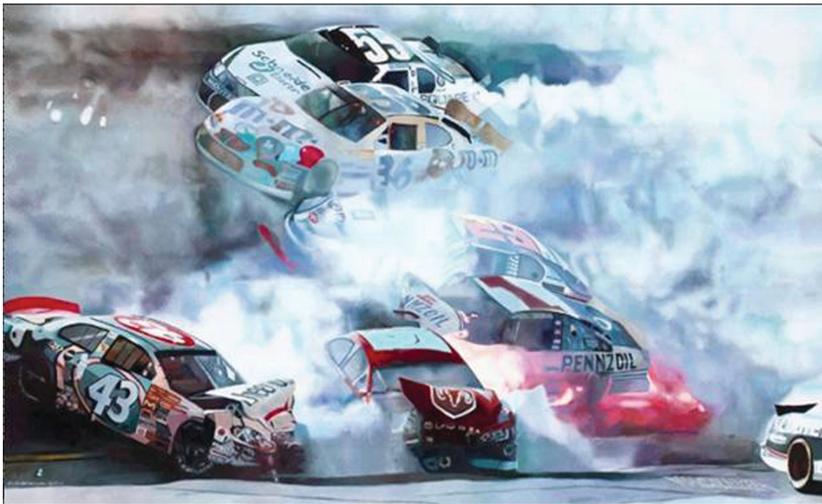
تصویر (۷): مورلی، برخورد ماشین، ۱۱۳×۱۸۲ سانتی متر، رنگ روغن، ۲۰۰۳، مجموعه خصوصی

مانند رئالیست‌های نو (New Realists) با یکدیگر گروهی را تشکیل دادند. در همین دوره، هر هنرمندی استفاده از تصویرسازی قابل فهم را فقط رئالیست نو می‌نامید و دلیلش این بود که آن دوره، دوره پس‌انتزاعی (Post Abstract) بود؛ دوره‌ای که این هنرمندان را از جنبش‌های رئالیستی پیشین متفاوت کرد. بعد از آن، اصطلاحات متعددی برای نشان دادن توصیفی حقیقی شاخه‌های گوناگون رئالیسم به کار رفت. در بین این اصطلاحات می‌توان به سوپرنرال، واقع‌گرایی جادویی (Magic Real)، هایپررئال، فوکوس تند و واقع‌گرایی رومانتیک اشاره کرد. همه این معانی مبهم بودند و ذاتاً قابلیت معاوضه داشتند؛ بعضی بی‌معنا بودند و در عین حال هیچ یک توصیفی حقیقی از این جنبش نداشتند. اصطلاح واقع‌گرایی جادویی اولین بار توسط آلفرد بار (Alfred Barr) در سال ۱۹۴۲ برای توصیف سوررئالیسم آمریکایی استفاده شد. لوئیس میزل (Louise. K. Meisel) می‌گوید: در سال ۱۹۶۸، بعد از دیدن آثار استیز و کلوز، در هر دو نمایش از آثار این هنرمندان و با توجه به روشی که به کار برده بودند، تشخیص دادم که این آثار رئالیسم عکسی (Photographic Realism) هستند. دو سال بعد در ۱۹۷۰ این اصطلاح در چاپ کاتالوگ موزه ویتنی در معرفی اولین نمایشش از این آثار، ظاهر شد که عنوان بیست و دو رئالیست (two Realists-Twenty) را بر آن گذاشته بودند. از دوره جدید یعنی ۱۹۷۰ به بعد، سعی اصلی بر نمایش رئالیسم نو در موزه نیویورک بود؛ اگرچه