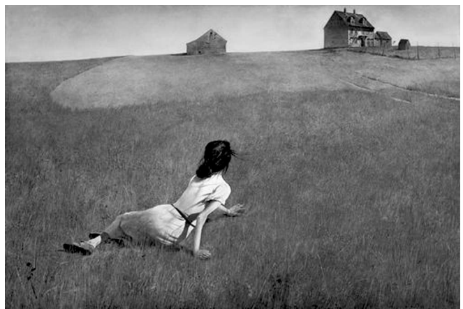
تصویر (۲): وایت، دنیای کریستینا، تمپرا، ۱۹۴۹ م