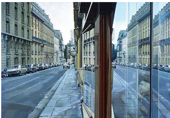
تصویر (۵): استیز، منظره‌ای از خیابان پاریس، ۱۹۷۲، رنگ روغن روی بوم، ۶۰ × ۴۰ اینچ