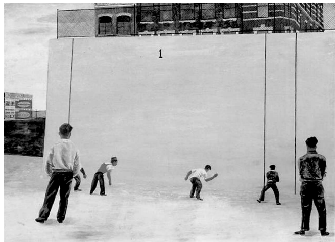
تصویر (۱): شان، هندبال، تمپرا بر روی کاغذ، ۱۹۳۹، ۴/۳ × ۴/۳۱ اینچ، موزه هنر مدرن، نیویورک