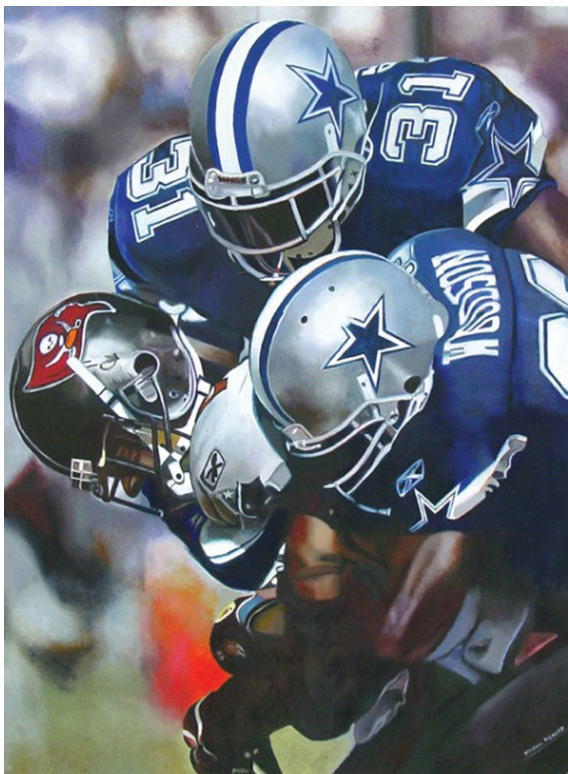
تصویر (۱۰): مورلی، درگیری، روغن روی کتان، ۴۹ × ۳۶ اینچ، مجموعه خصوصی، ۲۰۰۴

"مورلی در مصاحبه ای درباره موضوع این آثار جواب داد: موضوع این نقاشی ها "نقاشی" از آن هاست. من ارتباطی منطقی در نگاه مردم به این موضوعات برقرار کردم. نقاشی ها اجرا می شوند که دیده شوند. این ها بازیکنان هاکی روی یخ، اسکی، شنا و... هستند؛ همگی قهرمانان ورزشی اند. در زندگی نامه ای که از روتکو یافت شد، درباره اسطوره شناسی و اینکه چگونه در زمان های کهن اسطوره ها هر روز در کنار شما زندگی می کردند، سخن گفته شده. کلید عامل در اسطوره ها، قهرمانان هستند. در واقع من خواستم که نوعی اسطوره قهرمانان همگانی بسازم که این مستلزم شخصیت های ورزشی بود. وقتی ترانه ای برای عموم سروده می شود، باید وسوسه انگیز و گیرا باشد. بنابراین تصویر نیز باید گیرا و جذاب باشد. اما شما هیچ وقت درباره برداشت های مردم چیزی نمی دانید. اکثر مردم تصور می کردند که نقاشی های فتورئالیستی که در جنوب