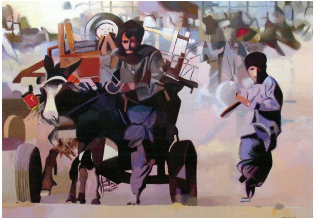
تصویر (۸): مورلی، پسر و الاغ، روغن روی کتان، ۱۲۹ × ۱۸۲ سانتی متر، مجموعه خصوصی، ۲۰۰۲