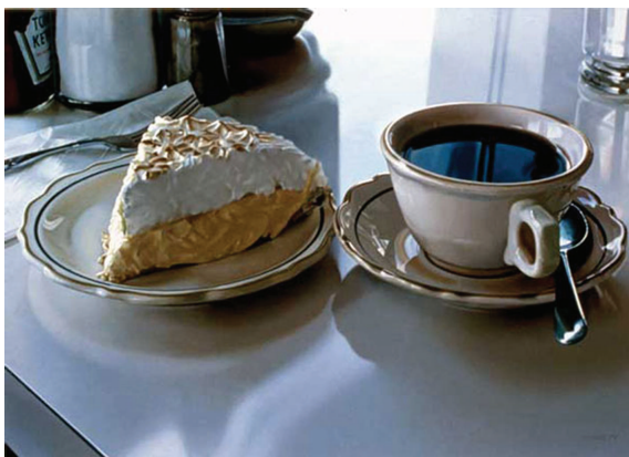
تصویر (۶): گوئینگز، کیک خامه‌ای، رنگ روغن روی بوم، ۲۶ × ۳۶ اینچ، ۱۹۷۹