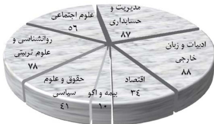
نمودار ۱- ترکیب نمونه آماری پژوهش به تفکیک دانشکده‌ها (به نفر)