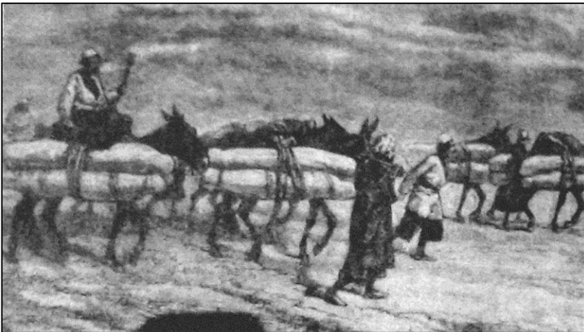
تصویر ۴. کاروان اموات در مسیر عتبات عالیات به روایت دیولافوا (دیولافوا، ۱۳۸۵: ۲۱۴).