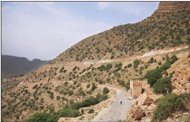
تصویر ۲. طاق گرا واقع در گردنه طاق گرا