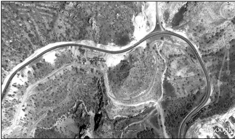
تصویر ۱. تصویر هوایی طاق گرا را در گردنه طاق گرا یا عقبه خلوان.

رخدادهایی می‌توانست مانع از حضور زائران در عتبات عالیات گردد؛ به گونه‌ای که در سال ۱۲۹۴ هـ.ق به واسطه وقوع بیماری وبا در عراق، دولت قاجار مسافرت زائران ایرانی به عراق را ممنوع کرد و در مقابل، آنان را تشویق به زیارت امام هشتم در مشهدالرضا نمود (Litvak, 2001: 33).