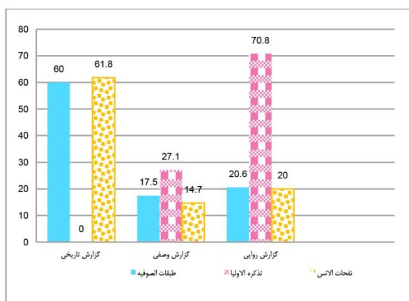
نمودار ۱. فراوانی شیوه‌های وصف شخصیت ذوالنون در سه اثر

جامی مقامات را علت لقب ذوالنون بیان می کند: «ذوالنون از آن است که وی را بنیاریند به کرامات، و بنستایند به مقامات، مقام و حال و وقت در دست وی سخره بود و درمانده» (همان: ۲۸).