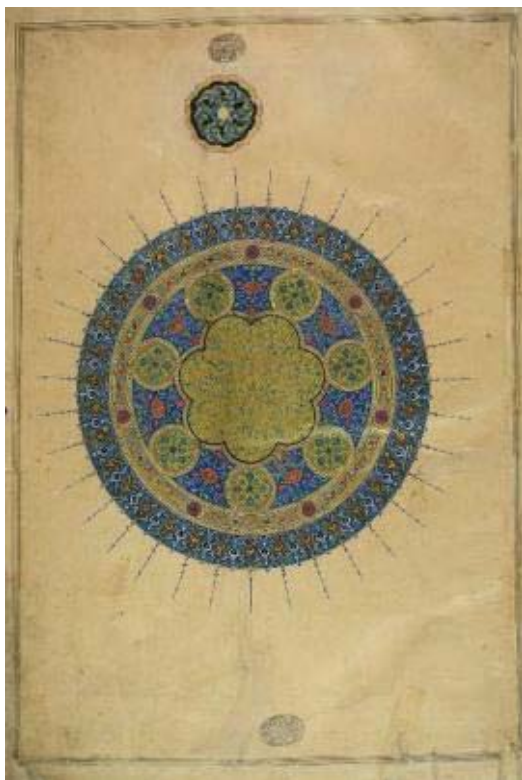
تصویر ۱- شمسه شاهنامه بایسنقری، هرات، ۸۳۳ ه.ق.، موزه کاخ گلستان، شماره اثر: ۱۷۱۶ (URL 1).

در این پژوهش، با انتخاب صفحات مشترک، همچون شمسه صفحه فرمان آغاز کتابت (تصاویر ۱ و ۲)، صفحات افتتاحیه یا مقدمه (تصاویر ۳ و ۴) و صفحات آغازین (تصاویر ۵ و ۶)، در دو شاهنامه بایسنقری و شاه تهماسبی - که در هر دو اثر، یک به یک قابل تطبیق بودند - به بررسی و تطبیق قالب کلی تذهیب صفحات و نقوش، رنگ، جدول کشی، گره و شرفه‌ها پرداخته شد. این بررسی‌ها، در سه جدول زیر ارائه شده است.