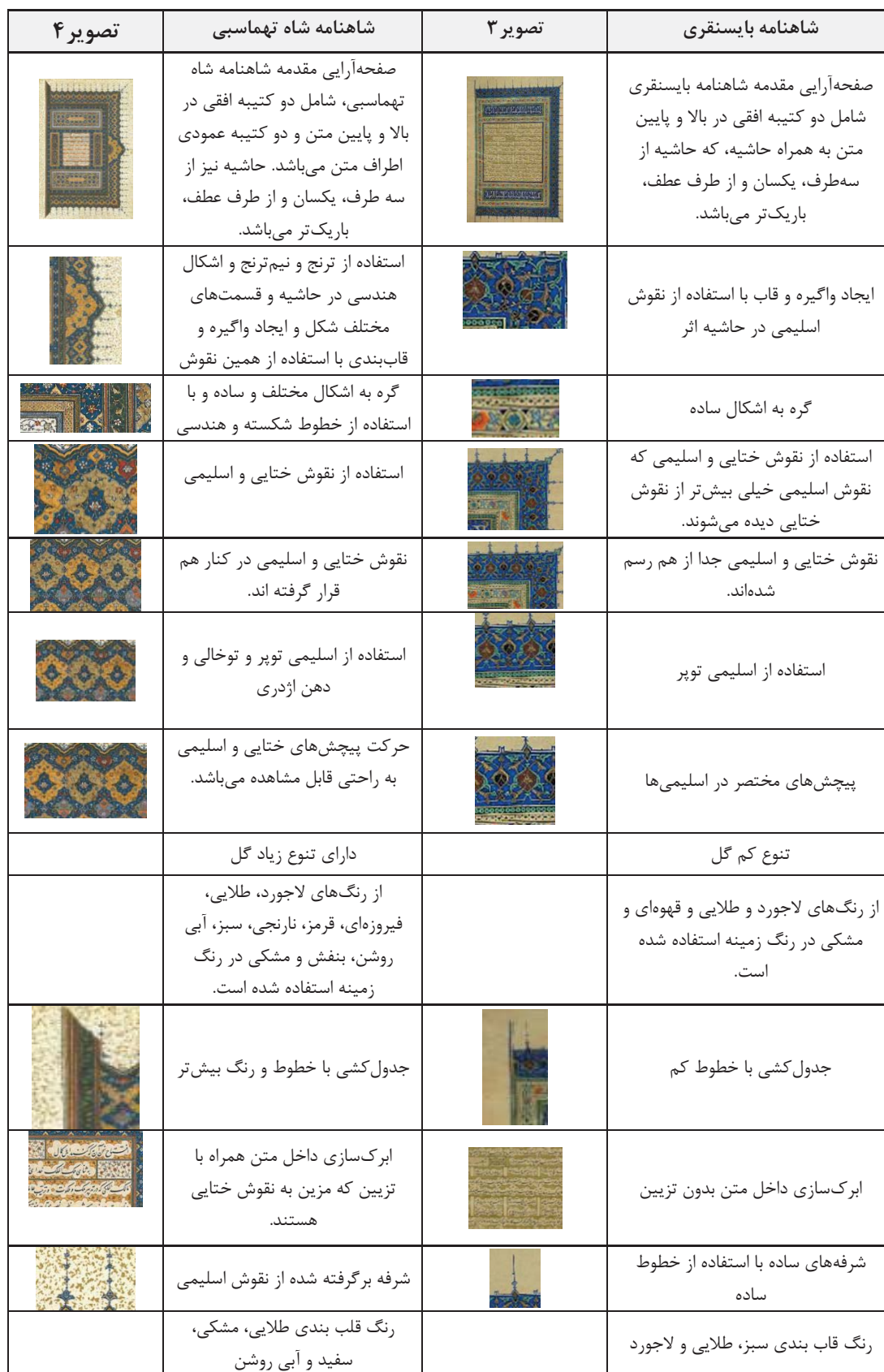
جدول ۲. بررسی تطبیقی مقدمه شاهنامه بایسنقری و مقدمه شاهنامه شاه تهماسبی