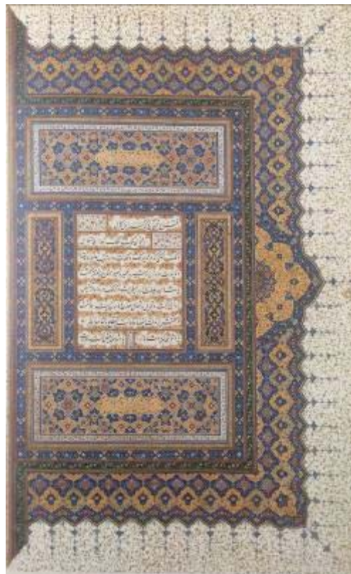
تصویر ۴- برگ مقدمه شاهنامه شاه تهماسبی، ۹۳۴ه.ق.، تبریز (Canby, 2011: 63).