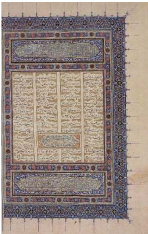
تصویر ۵- برگ آغازین شاهنامه بایسنقری، هرات، ۸۳۳ه.ق. موزه کاخ گلستان، شماره ثبت اثر: ۷۱۶ (URL 1).

وافر مذهبیان دوره صفوی، در هر چه غنی تر کردن نقوش است.