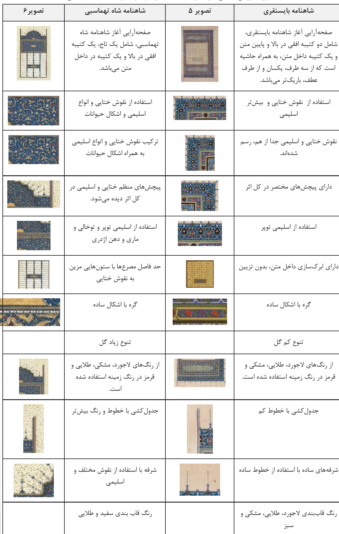
جدول ۳. بررسی تطبیقی آغاز سخن شاهنامه بایسنقری و آغاز سخن شاهنامه شاه تهماسبی

جلوه هنر، دوره جدید، سال ۱۱، شماره ۱، بهار ۱۳۹۸، شماره پیاپی: ۳۲