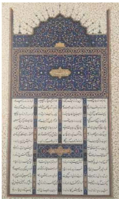
تصویر ۶- برگ آغازین شاهنامه شاه تهماسبی، تبریز، ۹۳۴ه.ق. (Canby, 2011:67).

گره، به اشکال ساده در شاهنامه بایسنقری دیده می‌شود؛ ولی در تذهیب مقدمه شاهنامه شاه تهماسب، تنوع و پیچیدگی بیشتری وجود دارد. در این بخش نیز در شاهنامه بایسنقری، اسلیمی‌ها برتری دارند و از ختایی‌ها جدا هستند؛ اما در شاهنامه شاه تهماسب ختایی‌ها برتری دارند و در کنار اسلیمی‌ها قرار گرفته‌اند. در شاهنامه شاه تهماسب، بر تنوع اسلیمی افزوده شده و علاوه بر اسلیمی توپر، از اسلیمی توخالی و دهن اژدری نیز استفاده شده است؛ گل‌ها تنوع بیشتری یافته و پیچش‌های ختایی و اسلیمی قابل رؤیت‌تر شده‌اند. در زمینه شمس شاهنامه بایسنقری رنگ‌ها محدود به لاجوردی، طلایی، قهوه‌ای و مشکی است. در شاهنامه شاه تهماسبی رنگ‌ها افزایش یافته و شامل لاجوردی، طلایی، فیروزه‌ای، قرمز، نارنجی، سبز، آبی روشن، بنفش است. خطوط در جدول‌کشی‌ها افزایش یافته، ابرک‌سازی داخل متن از سادگی در آمده و مزین به نقوش ختایی شده است. سادگی در شرفه‌های شاهنامه بایسنقری نیز وجود دارد؛ اما شرفه‌های برگرفته شده از نقوش اسلیمی در این برگ از شاهنامه شاه تهماسب، نشانگر دقت و تلاش