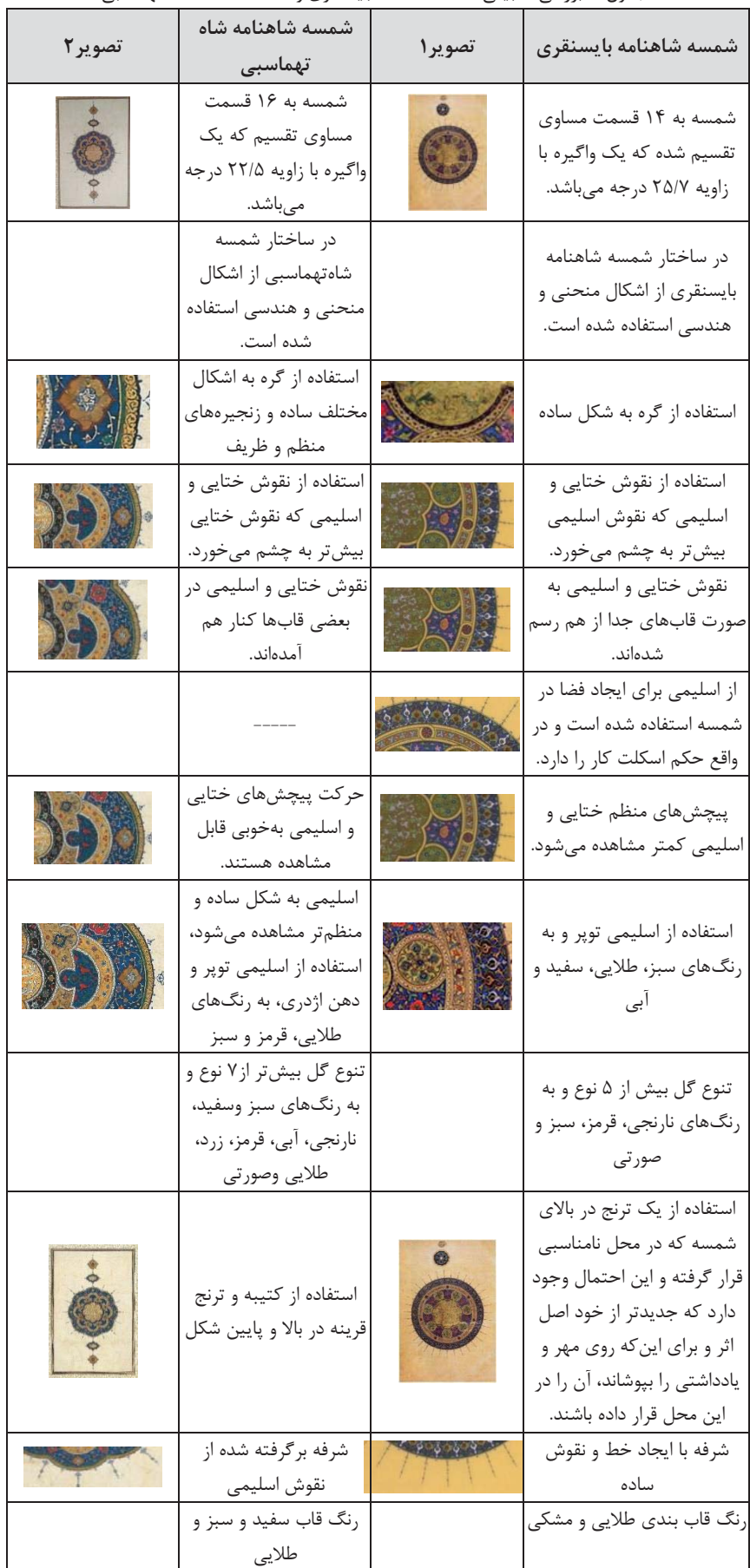
جدول ۱. بررسی تطبیقی شمشه شاهنامه بایسنقری و شمشه شاهنامه شاه تهماسبی