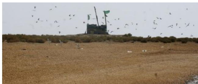
شکل ۲: نمای جزیره قبر ناخدا

جزیره قبرناخدا در خور موسی در استان خوزستان در جوار شهر ماهشهر در موقعیت جغرافیایی ۳۰ درجه ۲۰ دقیقه و ۲۶ ثانیه عرض شمالی و ۴۸ درجه و ۵۵ دقیقه و ۵۳ ثانیه طول شرقی قرار دارد (اداره کل حفاظت محیط زیست خوزستان، ۱۳۹۲؛ بهروزی راد، ۱۳۸۷a). مساحت آن در زمان مد ۳ هکتار و در زمان جزر به ۵۰۰ هکتار میرسد (Behrouzi-Rad, 2014a). در وسط جزیره مقبره ناخدا قرار دارد (شکل ۲) که جزیره نیز به همین نام شناخته شده است. بخشهایی که در زمان مد زیر آب میروند و در زمان جزر از زیر آب بیرون می آیند، گلی و فاقد پوشش گیاهی است (شکل ۲). مساحت دائمی جزیره ۳ هکتار است و حدود ۴۰ درصد آن پوشیده از گیاه است. تراکم گیاهی با روش پلات گذاری شناسایی و اندازه گیری شده است. گونه های گیاهی موجود شامل ( Atriplex leucoclada , Stipa capensis , Suaeda fruticosa , Halostachys belangeriana , Calanderula persica , Malva sp , Cistanche tubolusa ). Suaeda fruticosa بود (اداره کل حفاظت محیط زیست، ۱۳۹۲؛ Behrouzi-Rad, 2013a). پرستودریایی پشت دودی در زیر این گونه های گیاهی آشیانه می سازد (Behrouzi-Rad, 2013a; 2013b). شکل ۲ جزیره قبرناخدا و شکل ۳ محدوده آشیانه سازی گونه را در آن جزیره نشان میدهند.