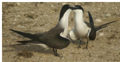
شکل ۱: پرستو دریایی پشت دودی در جزیره قبرناخدا، (بهروزی راد، ۱۳۹۴)