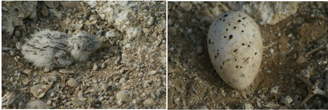
شکل ۴: جوجه، تخم و آشیانه پرستو دریایی پشت دودی در جزیره قبرناخدا

مراحل زمانی فنولوژی تولیدمثل پرستو دریایی پشت دودی در ۱۴۲ آشیانه در جزیره قبرناخدا در جدول ۱ نشان داده شده است. میانگین قطر بزرگ تخمها 0.23 \pm 0.043/43 میلیمتر، میانگین قطر کوچک، 0.15 \pm 0.031/11 میلیمتر، میانگین وزن تخمها در زمان تفریح 0.56 \pm 0.17/78 گرم بود که 20/11 درصد کاهش نشان می‌دهد. میانگین حجم تخمها 20/453 میلیمتر مکعب گزارش می‌گردد. رنگ تخمها نخودی کم‌رنگ با خال‌های تیره و جلادار بود. شکل تخم بیضی و مقدار 3/09 \pm 71/63 به دست آمد (شکل ۴). میانگین پارامترهای آشیانه و تخم پرستو دریایی پشت دودی در جزیره قبرناخدا در سال ۱۳۹۴ در جدول ۲ نشان داده شده‌اند.