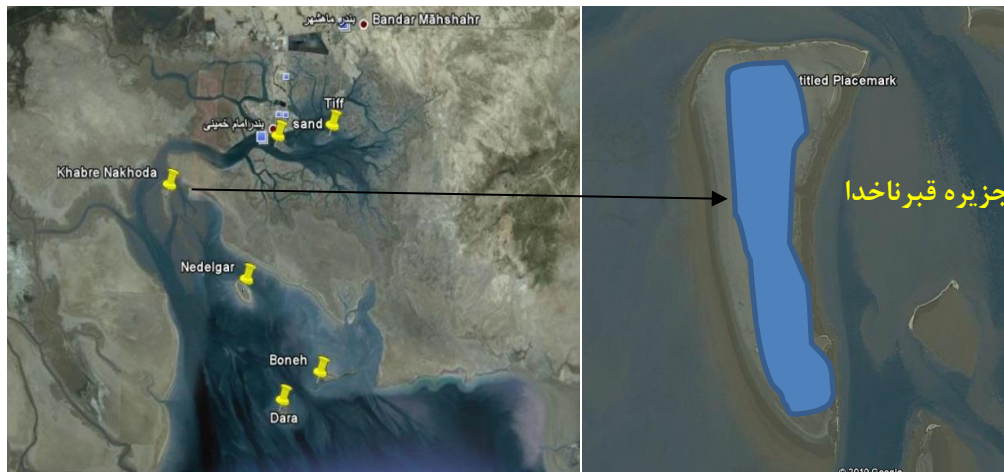
شکل ۳: محدوده جوجه آوری پرستو دریایی پشت دودی در جزیره قبرناخدا (Google Earth 2015)