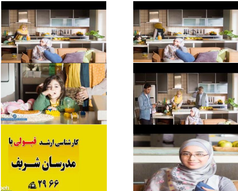
شکل ۱: آگهی تبلیغاتی مؤسسه مدرسان شریف

مکان تصویربرداری این آگهی نشان‌دهنده فضای درونی یک خانه است. در اولین نما (سمت راست) دختر جوانی را با عینک و لباس طوسی رنگی می‌بینیم که بر روی کاناپه نشسته است. او، دستش را زیر چانه گذاشته و آرنج خود را به کوسنی تکیه داده است. حالت چهره و شیوه نشستن