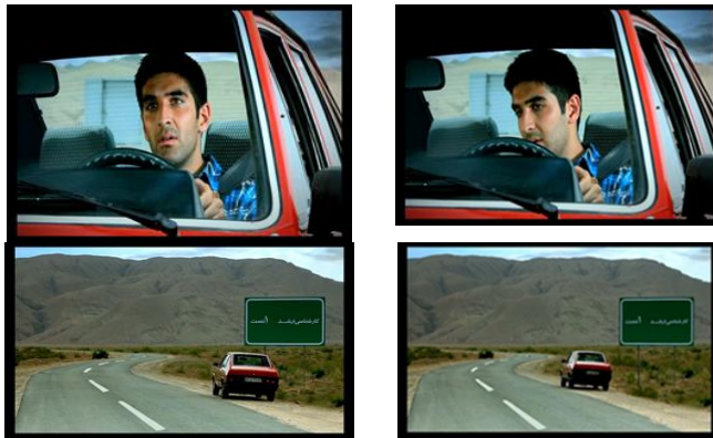
شکل ۱: آگهی تبلیغاتی مؤسسه پارسه

دومین آگهی انتخابی متعلق به مؤسسه آموزشی پارسه است. در اولین نما از این آگهی چهره مرد جوانی را می‌بینیم که با اضطراب در داخل یک ماشین قرمز به تنهایی در حال رانندگی در یک جاده کاملاً خالی است. در این میان، دو سمت جاده کمی سرسبز است و در مقابل کوهی نمایان است. هم‌زمان گوینده رادیو با لحنی تا اندازه‌ای جدی می‌گوید: «راننده گرامی!». مرد جوان سر را بالا و به دورین نگاه می‌کند و سپس گوینده ادامه می‌دهد: «فاصله باقی مونده تا قبولی در کارشناسی ارشد فقط یک تسته». در این زمان دورین سمت عقب ماشین را نشان می‌دهد، در حالی که اتومبیل ایستاده و سپس به سمت عقب حرکت می‌کند؛ جایی که یک تابلوی سبز رنگ بزرگ همانند تابلوهای راهنمایی در کنار جاده قرار گرفته است که بر روی آن جمله «کارشناسی ارشد ۱ تست» با رنگ سفید نوشته شده است. سپس صدای گوینده دیگری به گوش می‌رسد که می‌گوید «فاصله تا موفقیت یک تست است. همپا». هم‌زمان همین پاره گفته بر روی یک صفحه قرمز رنگ نمایان می‌شود. همچنین جمله در داخل یک قاب مشکی و واژه همپا با یک قلم