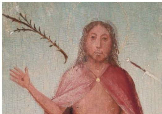
تصویر ۱۴- چهره مسیح بوش (URL1)

همچون بخش زیادی از تابلوهای بوش که به زبان تمثیل و استعاره بیان شده، به نظر می‌رسد که در این اثر نیز شاخه‌ی گل سوسن ۱۷ را که در فرهنگ مسیحیت، نمادی از مریم مقدس و پاکی او است، در سمت راست مسیح، جایگزین وی کرده باشد. چهره‌ی مسیح در اثر بوش تا حدود زیادی برگرفته از شمایل‌های دوران قرون وسطایی است که هیچ‌گونه بیان بصری در آن‌ها مشاهده نمی‌شود. گویی تنها این مسیح است که به عنوان خدای پسر با چشمانی نافذ، ناظر بر کردار آدمی است. نقطه‌ی مشترک مسیح در هر دو اثر، آثار جراحی بر پهلوی و دست و پایش است (تصویر ۱۴). در مجموع، به نظر می‌رسد آثار بوش تا حد زیادی وابستگی انکارناپذیری به سبک و سیاق و طرز تفکر قرون وسطایی دارد. در حالی که آثار میکلانژ، تماماً با اندیشه‌ی انسان‌گرایی دوران رنسانس همخوانی دارد. این در حالی است که فاصله‌ی بین خلق اثر بوش و میکلانژ کمتر از سه دهه است. با آنکه هر دو تابلو تقریباً در یک بازه‌ی زمانی خلق شده‌اند، اما دو هنرمند دو زاویه دید مختلف از یک موضوع را ترسیم نموده‌اند. درباره‌ی این تفاوت‌های مضمونی، پس از تحلیل جدول دست‌یافته‌ها بحث خواهد شد.