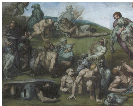
تصویر ۱۳- برخاستن مردگان از گور، جزئی از اثر داوری اخروی میکلانژ (URL2)

تلخ نهفته و از سوی دیگر فضای دهشتناک اثر، کلیت آن را به سمت تسلیم و ناامیدی می‌کشاند. نقاشی بوش برای عموم خلق شده بود. اثر او بر روی تابلوی سه‌لت کار شده (منقول) و نه دیوار، بنابراین بستری که اثر در آن دیده و مورد خوانش قرار می‌گیرد، می‌تواند متغیر باشد. این بستر ممکن است کلیسا، موزه یا هر جای دیگری باشد. در تابلوی بوش، انسان‌های پراکنده شده در بین عناصر غیر انسانی، با توجه به تعدد و به لحاظ ارزش بصری، همگی دارای یک ارزش هستند. برای مثال انسان همان قدر خودنمایی می‌کند که چاقو یا ساختمان. مسیح در اثر بوش در بالای تابلو دیده می‌شود و از بالا نظاره‌گر اتفاقات است. در اثر میکلانژ، چنین به نظر می‌رسد که حکم صادر شده و در حال اجرا است و مسیح اکنون به تماشا نشسته است؛ در حالی که قدیسین و حواریون، وحشت‌زده از وقایع در حال رخ دادن در حال التماس و دعا هستند (تصویر ۱۳). میکلانژ در سمت راست مسیح، مریم مقدس را ترسیم کرده است. او چهره‌ی مسیح را - به عمد و نه سهواً - با الهام از چهره‌ی آپولون - از خدایان یونان باستان - ترسیم نموده و در آن حالات چهره‌ی انسانی جلوه‌گر است. نگاه مسیح به سمت مخاطب اثر نیست و برعکس، این مخاطب اثر است که به او و دیگر شخصیت‌ها می‌نگرد (تصویر ۹).