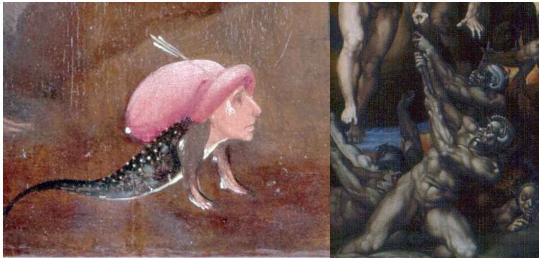
تصویر ۱۵- موجودات خیالی میکلائز (راست) و بوش (چپ) (URL1 و URL2)

قدیسه کاترین با چرخ، قدیس بلیز با ابزار قشوی اسب و قدیس سباستیانوس با تیرها نقاشی شده‌اند (تصویر ۱۶). در حالی که بوش تصویری از ابزارهای شکنجه‌ی مسیح را نشان نمی‌دهد. او ابزارهایی را ترسیم می‌کند که افراد بعد از صدور حکمشان در پایان جهان تا ابد توسط موجودات عجیب شیطانی با آن‌ها شکنجه می‌شوند. در واقع بوش سعی دارد «زندگی غیرقابل اجتناب از گناه» آدمی را نشان