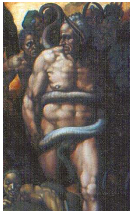
تصویر ۱۹- تصویرمار در تابلوی داوری اخروی میکلائز (URL2)

ناشناخته و کاملاً زاییده‌ی خیال هنرمند هستند. این موجودات ممکن است نیمه انسان، نیمه حیوان باشند و یا بدنی کاملاً انسانی داشته باشند (تصویر ۱۸). اما میکلائز تنها یک بار در اثرش از تصویر حیوان استفاده کرده و آن، «مار»ی است که بر بدن مینوس ۱۸ پیچیده است. دلیل آن هم احتمالاً این بوده که قصد داشته تا از این طریق، مینوس اساطیری را به مخاطبانش بشناساند؛ همان‌گونه که برای شناسایی خارون ۱۹ ، پارویی را در دستانش قرار داده است (تصویر ۱۹).