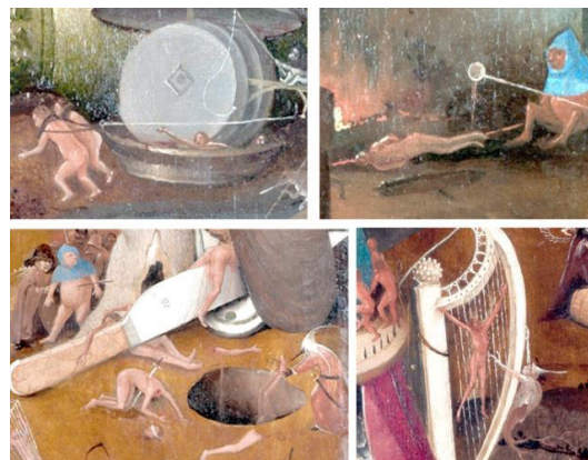
تصویر ۱۷- ابزارهای شکنجه در تابلوی داوری اخروی بوش (URL1)

دهد که جزای آن بلافاصله پس از مرگ داده می‌شود (تصویر ۱۷)؛ بنابراین می‌توان گفت ابزارهای ترسیمی توسط میکلائز، به نوعی ابزارهای نجات در دنیای ابدیشان خواهد بود، در حالی که ابزارهای ترسیمی بوش صرفاً جهت شکنجه‌های ابدی و نه نجات ابدی است. بوش برای زبان تمثیلی اثرش از تصاویر حیوانی نیز استفاده کرده که گاه مانند خروس، طاووس و گاو شناخته شده‌اند و گاه