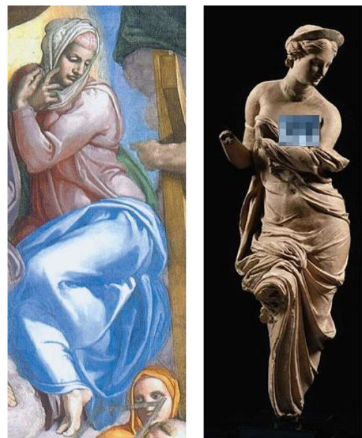
تصویر ۱۰- چهره مریم مقدس جزئی از اثر داوری اخروی میکلانژ (راست) و تندیس آفرو دیته (URL2 و URL3)