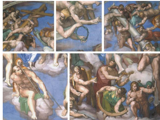
تصویر ۱۶- مسیح و قدیسین به همراه ابزارهایی که با آنها شکنجه شده‌اند. داوری اخروی میکلائز (URL2)