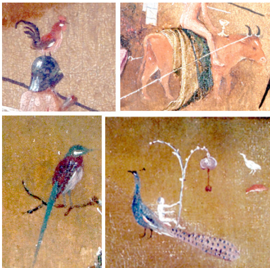
تصویر ۱۸- تصویر حیوانات در تابلوی داوری اخروی بوش (URL1)