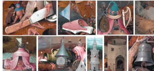
تصویر ۳- جزئیاتی از داوری اخروی بوش، بروژ، حدود ۱۵۰۰ م (همان)

کشتی، بشکه، صندل غول پیکر به شکل قایق، پرچم، ابزار آلات موسیقی همچون چنگ و عود، آب و آتش و دیگر اشکال نامعلومی که در سطح تابلو پراکنده شده اند (تصویر ۳).