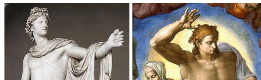
تصویر ۹- چهره مسیح با الهام از آپولون، جزئی از اثر داوری اخروی میکلانژ (راست) و تندیس رومی برگرفته از اثر لئو خارس یونانی (چپ) (URL2 و URL3)