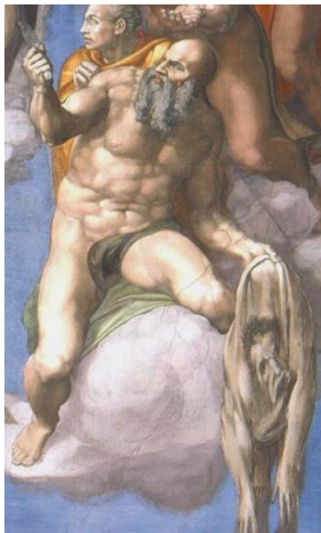
تصویر ۱۱- چهره میکلانژ بر بدن سن بارتولومه جزئی از اثر داوری اخروی میکلانژ (URL2)

بر نمی‌تابد. در نقاشی میکلانژ قلمرو بهشت، اما در نقاشی بوش، فضای عذاب آلود جهنم حاکم است. نقاشی میکلانژ برای مخاطبانی بسیار خاص، نخبه و دانشمند طراحی شده بود (همان). بستر کار میکلانژ، غیر منقول و ثابت (دیوار کلیسا) و در ارتباط با روایات تصویری دیگر ترسیم شده است؛ اما خوانش تصویر خود به تنهایی امکان پذیر بوده و الزاماً وابستگی به تصاویر بخش‌های دیگر اثر ندارد. میکلانژ برخلاف بوش عنصر انسانی را در اثرش غالب و برجسته نشان داده است. مسیح در اثر میکلانژ در مرکز قرار دارد. گویی هنوز حکمی صادر نشده و لحظه‌ای است که در آن مردگان با شنیدن صدای شیپور، در حال برخاستن از گور و حواریون و قدیسیان نیز در انتظار شنیدن حکمشان هستند (تصویر ۱۲).