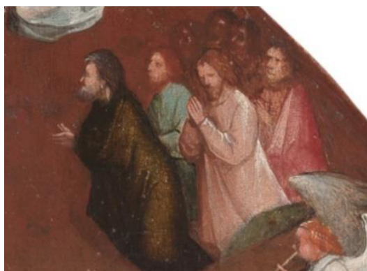
تصویر ۱۲- طلب‌آمزش قدیسیان از مسیح، بخشی از داوری اخروی بوش (URL1)

بوش هم‌زمانی استعاری و تمثیلی را برای خلق آثارش در نظر گرفته، اما زبان استعاری دو هنرمند متفاوت از یکدیگر است. در شخصیت‌پردازی‌های بوش، از یک سو نوعی طنز