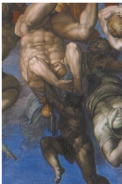
تصویر ۷- آویزان شدن کیسه پول و دو کلید از گردن یک جهنمی، جزئی از اثر داوری اخروی میکلائو (همان)

از گناه غرور است که تلاش می‌کند به عقب برگردد و متکبرانانه حکم الهی را به چالش می‌کشد، در حالی که روح سوم (در بیرونی‌ترین قسمت سمت راست) از پوست بیضه‌اش کشیده شده است (گناه او شهوت بود). این گناهان به طور خاص در خطبه‌هایی که به دادگاه پاپ تحویل داده شد، مشخص شده است (Camara, 2021) (تصویر ۷).