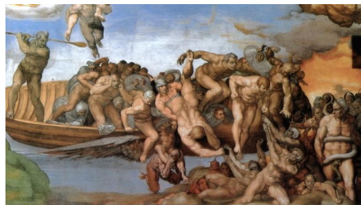
تصویر ۸- چارون و مینوس، جزئی از اثر داوری اخروی میکلانژ (همان)

آرام و گاه همراه با اندوه و نیز نشستن با وقار و ملکه‌گونه تصویر می‌شد، در حالی که در این نقاشی دیواری، چهره‌ای اساطیری از زاویه نمایش گذاشته شده است (تصویر ۱۰). کمی آن طرف تر سن بارتولومه را می‌بینیم، در حالی که پوست خالی بدن یک انسان را در دست دارد. میکلانژ برای صورت این پوست خالی، چهره خودش را به تصویر کشیده است (همان) (تصویر ۱۱).