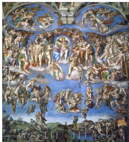
تصویر ۴- داوری اخروی میکلانژ، ۱۵۳۴-۱۵۴۱ م (URL2)

برنامه ی تزئینی نمازخانه ی کلیسای سیستین، تاریخ رستگاری و نجات را در برمی گیرد. این کار با آفرینش جهان توسط خداوند و پیمان او با بنی اسرائیل (که در صحنه های عهد عتیق و در سقف و دیوار جنوبی نشان داده شده) آغاز می شود و با زندگی زمینی مسیح (بر روی دیوار شمالی) ادامه یافته و افزودن داوری اخروی، این روایت به انتها می رسد (همان). برخلاف دیگر روایات مقدس به تصویر کشیده شده در نقاشی های این کلیسا که وقایع گذشته را روایت می کنند، «داوری اخروی» نشانگر اتفاقیست که هنوز نیفتاده و به نوعی پیش گوینه است (همان). میکلانژ این