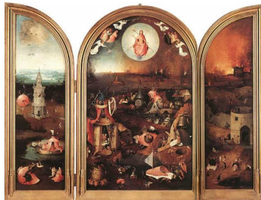
تصویر ۱- داوری اخروی بوش، بروژ، حدود ۱۵۰۰م (URL)

در مقابل نیز گاهی تصاویری از بهشت و نجات برمی‌شمرند (Gibson, 1973: 9)؛ هرچند که به لحاظ زمانی وی در دوران رنسانس یعنی قرن پانزدهم میلادی می‌زیسته است. سه تابلو با موضوع داوری اخروی منسوب به بوش است که در بلژیک، وین و مونیخ قرار دارند. تابلویی که در مونیخ قرار دارد به نظر می‌رسد که توسط دستیارانش اجرا شده باشد. در این پژوهش، تابلوی موجود در بلژیک (بروژ) با اثر میکلائز مطابقت داده می‌شود (تصویر ۱). قاب سه‌لوحی بروژ در بین سال‌های ۱۴۹۵ تا ۱۵۰۵ خلق شده است. این نقاشی رنگ روغن، روی قاب سه‌لوحی بلوط به ابعاد پانل سمت چپ ۹۹٫۵ در ۲۸٫۸ سانتی‌متر، پانل مرکزی ۹۹٫۲ در ۶۰٫۵ سانتی‌متر و پانل سمت راست ۹۹٫۵ در ۲۸٫۶ سانتی‌متر ترسیم شده است (Fernandes, 2016: 7). اگرچه دندروکرونولوژی ۱۳ نشان می‌دهد که تاریخ زیاد مرکزی بعد از سال ۱۴۸۰ است، اما از نظر آماری با احتمال زیاد سال ۱۴۸۲، تاریخ آفرینش این اثر در نظر گرفته شده است (همان: ۱۰). در پشت درهای باز شونده‌ی این تابلوهای سه‌لته، نقاشی‌هایی در ارتباط با مسیح یا قدیسیان اجرا شده که هنگام بسته شدن لت‌ها مشاهده می‌گردند. در این مقاله به آنها پرداخته نمی‌شود.