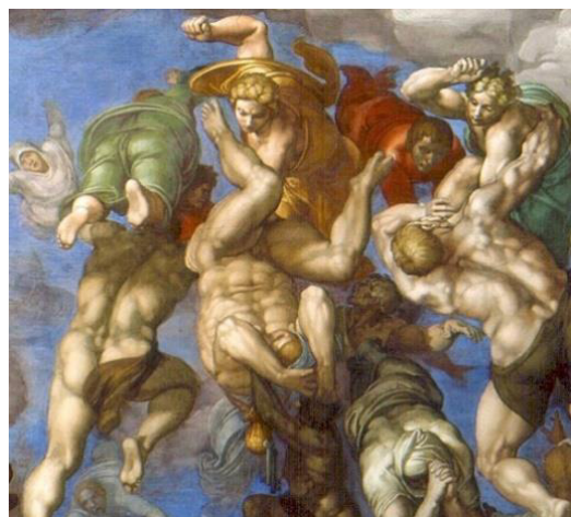
تصویر ۶- جلوه‌گیری از فرار جهنمیان، جزئی از اثر داوری اخروی میکلائو (همان)

اثر را با الهام از رویای حزقیال نبی، توصیف‌های متنی از روز ظهور پسرانسان، کمدی الهی دانته و پرده واپسین داوری سینیورلی ۱۵ تصویر کرده، اما مهمترین آن الهام‌ها، سرود روز غضب ۱۶ است (چاواری، ۱۳۸۸: ۱۶۷).