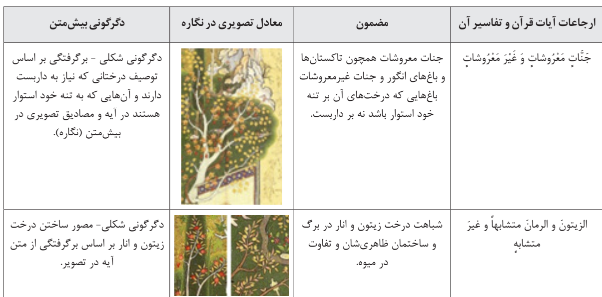
جدول ۲. ارجاعات قرآنی نگاره (نگارندگان).

برهنه بر ورودی درب باغ مصور شده؛ او از باغبان، خوشه‌ای انگور گرفته و در ظرف خود گذاشته است. سویی دیگر، پسر جوانی که به لباس‌های فاخری ملبس است، سوار بر الاغ خود در بیرون در باغ مصور شده است. او خوشه انگوری در دست دارد و مردی که گویا خدمه اوست، سر خود را برگردانده و در حال نگاه کردن به پسر بچه و میوه‌های باغ است، در حالی که افسار الاغ را به دست گرفته است. گویا مرد جوان به همراه خدمه‌اش از مهمانان سلطان هستند که به باغ دعوت گردیده‌اند. در تفسیر المنار پیرامون آیات ۱۳۹ الی ۱۴۲ سوره انعام در مقرر کردن حق محصول (حق حصاد) چنین آمده است: «(کانوا یجعلون نصیب الله تعالی لقری الضیفان و اکرام الصبیان و التصدیق علی مساکین و نصیب آلہتم لسدنہا و قراینہا و ما ینفق علی معاہدہا) از جمله آداب‌شان این بود که، از زراعت‌ها و محصولات در دو بخش، بخشی برای خداوند قایل می‌شدند که در مورد استفاده از سهم خداوند، روایت است که از سهم خداوند برای پذیرایی از مهمان و گرامی‌داشت جوانان و جنس مذکر استفاده می‌کردند» (محمد رشید، ۱۴۱۴: ۱۲۳-۱۲۵). چنین به نظر می‌رسد مصور کردن مهمان‌هایی هستند که قصد ورود به باغ را دارند - پسر جوان و خدمه - بی ارتباط با این تفسیر قرآنی نباشد (جدول ۲).