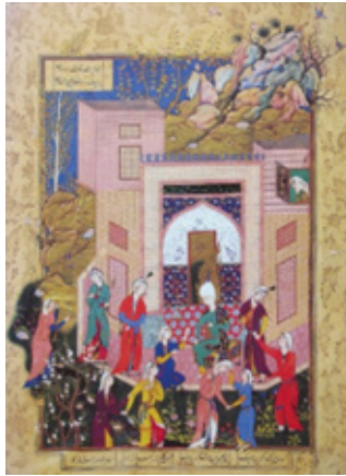
تصویر ۷- حضرت یوسف ندیمه‌های زلیخا را در باغ قصر اندرز می‌گوید، هفت/ورنگ جامی، ۹۶۳ ه. ق.، 15/9cm×.34/5 شماره ثبت در گالری فریر: (URL8) F1946.12.114.

از دیگر پیرامتن‌های درون‌متنی نگاره، می‌توان به تقدیم یا اهدا و پیشکش‌هایی که توسط کتاب این نسخه در جای جای هفت اورنگ آمده، اشاره داشت؛ در انتهای کتابت نسخه، مالک دیلمی شاهزاده را چنین معرفی می‌نماید: «برسم بیت‌الکتب السلطان العادل الكامل مختص بمزید الکرامه الالهیه الممتازین السلاطین بالطف الحضرت الشاهیه اغنی سلطان ابراهیم میرزا لا زال ظلال سلطنه فی ظل ظل الله ظلیلہ و آثار مکاریه فی البرایا جلیله» (تصویر ۸). و هم‌چنین: «مرقوم شد دفتر اول سلسله‌الذهب بامر عالی نواب نامدار کامکار خسرو عالم‌دار گردون اقتدار و هو السلطان العادل الكامل الفاضل ابوالفتح سلطان ابراهیم میرزا احسنی الصفوی علی ید الفقیر اقل عبیده مالک‌الدیلمی فی ذی‌الحجه سنه ثلث و الستین و التسعمانه بالمشهد المقدس المعلا» (تصویر ۹).