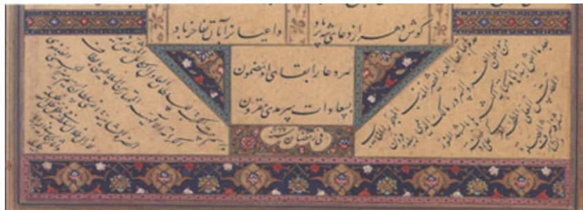
تصویر ۸- صفحه پایانی دفتر اول سلسله‌الذهب، قزوین، ۹۶۶ ه. ق.، به خط مالک دیلمی، 13cm×8/21. (Simpson, 1997: 29)

تهیه نسخه هفت/ورنگ، هم‌زمان با فرمانفرمایی ابراهیم میرزا در خراسان بوده است و شاید چندان دور از ذهن نباشد که دوران زندگی تجسم یافته در هفت/ورنگ را با دوران زندگی ابراهیم میرزا مقایسه کنیم و نگاره مورد بحث را در ارتباط با جامعه زمان شاهزاده صفوی در نظر بگیریم؛ ماریانا سمپسون ۱۴ در این باره چنین بیان می‌دارد: «نیز او [ابراهیم میرزا] می‌خواست با استفاده از هنر نگارگری جنبه‌هایی از زندگی خود را با پیام‌های هفت/ورنگ درهم آمیزد» (Simpson, 1997: 19). ابراهیم میرزا در ملازمت شاه طهماسب به حکومت مشهد منسوب شد و از آن‌جا که مصورسازی و خوشنویسی هفت/ورنگ مقارن با آغاز حکمرانی ایشان در مشهد و ازدواج او با گوهر سلطان خانم دختر ارشد شاه طهماسب بوده، از این میان مجالس متعدد و نگاره‌های هم‌چون منظومه «یوسف و زلیخا» و «ورود عزیز مصر به پایتخت و مهمانی شاهانه یوسف» به مناسبت ازدواج او بیانگر مراسمی هستند که با ازدواج شاهزاده و گوهر سلطان خانم هم‌سوئی دارند. به نظر می‌رسد نگاره‌های این نسخه که به مراسم عروسی و جشن اختصاص یافته، او را نشان می‌دهد؛ چنانچه نگاره‌های حضرت یوسف (ع) و برپایی جشن با شکوه (تصویر ۳) و حضرت یوسف ندیمه‌های زلیخا را در باغ قصر اندرز می‌گوید (تصویر ۷)، نگاره‌هایی هستند که مستقیماً در کتیبه‌ها به ابراهیم میرزا اشاره دارند.