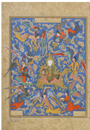
تصویر ۵- معراج حضرت محمد (ص)، هفت/اورنگ جامی، ۹۶۳ ه. ق.، شماره ثبت در گالری فریر: F1946.12.275 (URL2).