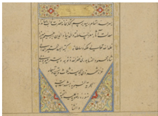
تصویر ۱۰- پایان نسخه هفت‌اورنگ ذکر نام حامی نسخه، سبحة‌الابرار هفت‌اورنگ، مشهد، ۹۶۳ ه. ق.، به خط شاه محمود نیشابوری، شماره ثبت در گالری فریر: 13cm x 8/21. FGA F1946.12.181 (URL5).