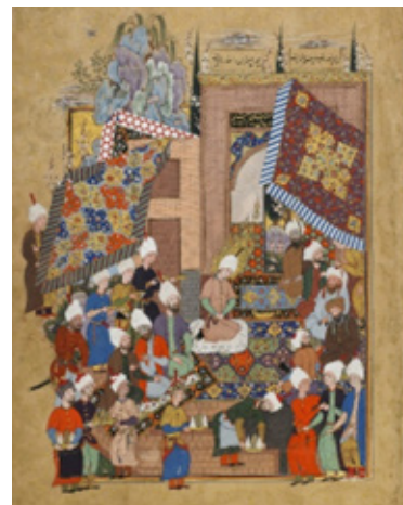
تصویر ۳- حضرت یوسف (ع) و برپایی جشن با شکوه، هفت/اورنگ جامی، ۹۶۳ ه. ق.، شماره ثبت در گالری فریر: F1946.12.132 (URL9).