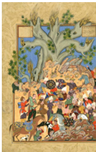
تصویر ۶- مرگ اسکندر، هفت/اورنگ جامی، ۹۶۳ ه. ق.، شماره ثبت در گالری فریر: F1946.12.298 (URL3).