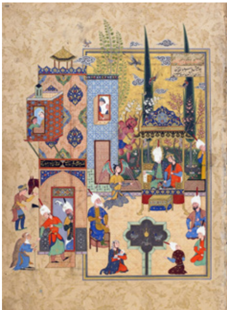
تصویر ۴- حضرت سلیمان و بلقیس، هفت/اورنگ جامی، ۹۶۳ ه. ق.، شماره ثبت در گالری فریر: F1946.12.188 (URL1).

این نسخه به نسخه هفت/اورنگ/ابراهیم میرزا/ شهرت دارد که از مهم‌ترین پیرامتن‌های درون‌متنی این نگاره برای منتسب دانستن تصویر هياتی که در مرکز نگاره تصویر شده‌اند و ترجمان تصویری حاکم یا سفارش دهنده اصلی نسخه هستند، محسوب می‌شود. در مقایسه سایر نگاره‌های هفت/اورنگ با نگاره مذکور، از دیگر موارد پیرامتن‌های درون‌متنی باید به سنتی مشترک اشاره کرد که در به تصویر کشیدن چهره و جایگاه امرا و حاکمان رایج بوده؛ چنان‌چه شخص حاکم را با توجه به جایگاه و شان و منزلت او در مرکز نگاره مصور می‌کردند. نگاره‌های «حضرت یوسف (ع) و برپایی جشن با شکوه»، «حضرت سلیمان و بلقیس»، «معراج حضرت محمد (ص)» و «مرگ اسکندر» در این نسخه به همین شیوه، شخص دارای جایگاه اجتماعی و حکومتی را در مرکز نگاره مصور کرده‌اند (تصویرهای ۳-۶).