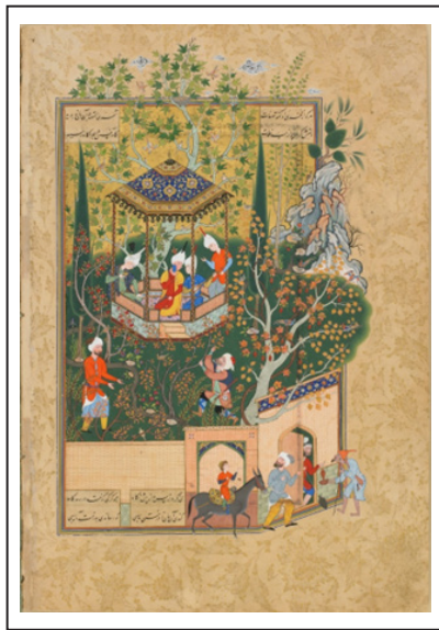
تصویر ۱- حکایت شهری و روستایی، منسوب به شیخ محمد، هفت‌اورنگ جامی، ۹۶۳ ه. ق.، 23/4cm×34/5. شماره ثبت در گالری فریر: F1946.12.179 (URL7).

بینامتنی در حیطه تراغونگی دارد؛ چرا که نظام کلامی به نظام تصویری مبدل گشته است. در متن شعر، طبیعت که به وسیله مراقبت و موانست باغبان با محیط هم‌چون باغ و بهشت توصیف گردیده، این حد از فراوانی، وفور و نعمت در میوه و ثمره باغ در نگاره، با ترسیم وسعت شاخه‌های درختان که از دیوار باغ بیرون زده‌اند، مصور شده است (تصویر ۱).