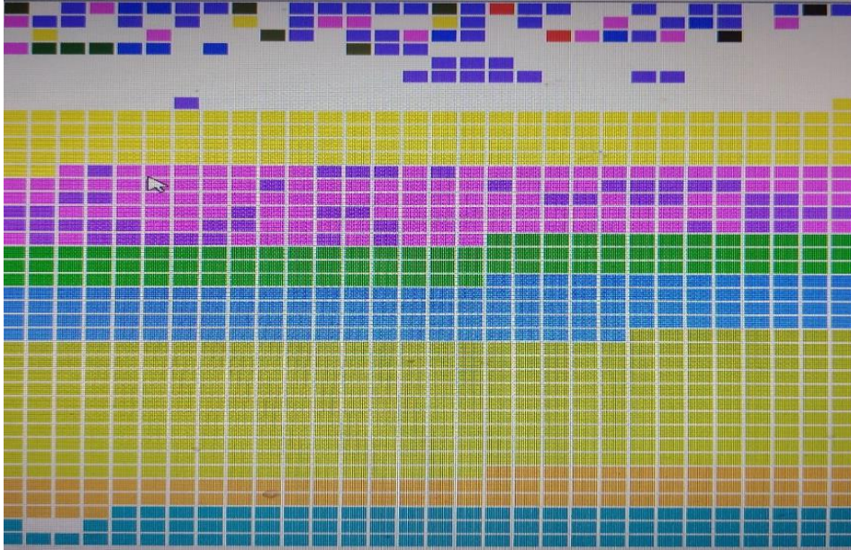
شکل شماره ۲. پراکندگی کدهای مهارت‌های معلمی

در این خروجی از نرم‌افزار maxqda، مهارت تدریس بارنگ سفید، مهارت نظارت و ارزیابی با رنگ زرد، مهارت برنامه‌ریزی با رنگ نارنجی، مهارت پژوهش با رنگ سبز، مهارت سازماندهی و مدیریت کلاس با رنگ صورتی، مهارت استفاده از مواد و تکنولوژی با رنگ آبی، مهارت خلاقیت با رنگ آبی تیره، مهارت‌های ارتباطی با رنگ یشمی و مهارت‌های فردی معلم با رنگ بنفش نشان داده شده است.