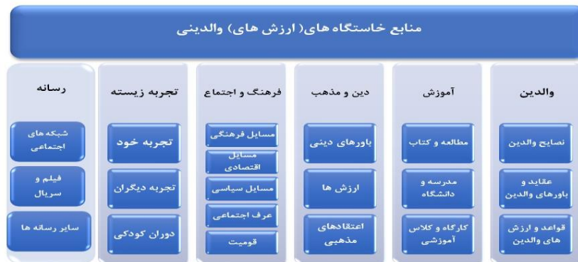
شکل ۳- نمودار منابع خاستگاه‌های (ارزش‌های) والدینی

۶ والدین: نصایح والدین، عقاید و باورهای والدین، قواعد و ارزش‌های والدین از جمله مفاهیم اصلی بودند که توسط مشارکت‌کنندگان مطرح گشت و در قالب مقوله اصلی والدین قرار گرفت. در راستای نقش پررنگی که والدین در شکل‌گیری خاستگاه‌های والدگری فرزندان دارند یکی از مصاحبه‌شوندگان می‌گوید: "سبک‌های تربیتی والدین ما بیشترین اثربخشی را در شکل‌گیری باورهای والدگری ما دارد." شرکت‌کننده دیگری در همین زمینه می‌گوید: "به نظر من والدین، ایده‌ها و ارزش‌های فرزندپروری خود را از والدین خود یاد می‌گیرند. یعنی در حقیقت روش‌های تربیتی که در مورد خود آن‌ها به کار گرفته شده است را اقتباس می‌کنند." در پایان این بخش بر اساس گفته‌های شرکت‌کنندگان، مفاهیم استخراج شده و مقوله‌های اصلی نمودار منابع خاستگاه‌های والدینی طراحی شد که در شکل ۳ نشان داده شده است.