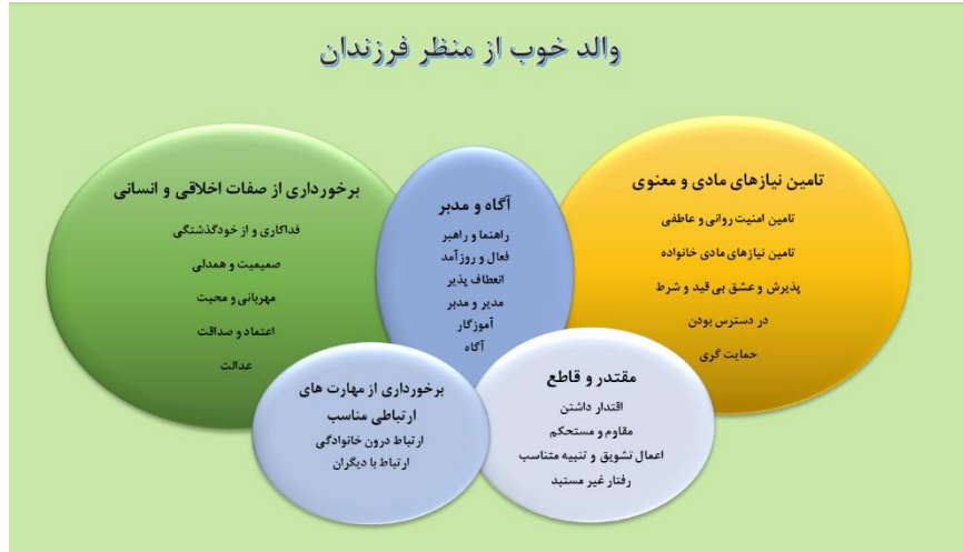
شکل ۱- والد خوب از منظر فرزندان

در پایان این بخش براساس گفته‌های شرکت‌کنندگان، مفاهیم استخراج شده و مقوله‌های اصلی نمودار والد خوب از منظر فرزندان طراحی شد که در شکل ۱ نشان داده شده است: