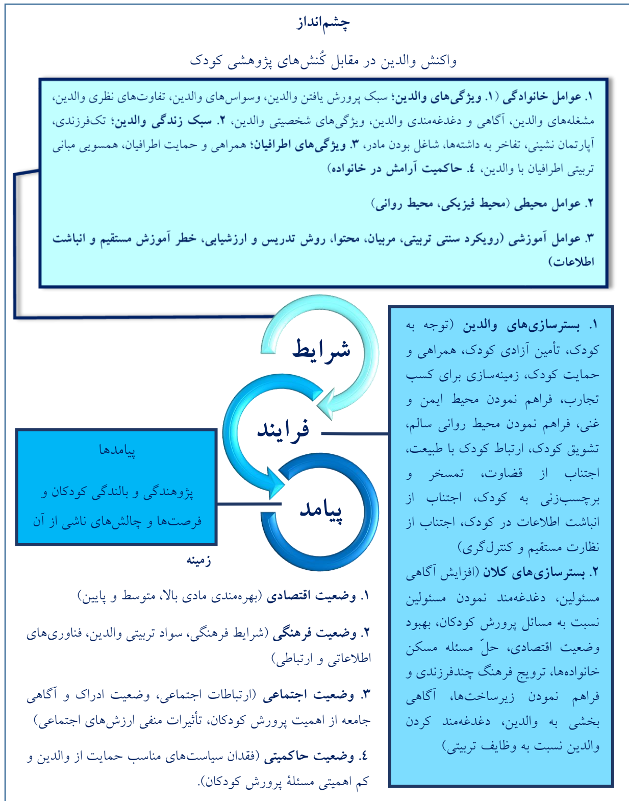
شکل ۲. نقشه مفهومی ابعاد پرورش کودکان پژوهنده

در انتهای این بخش برای مرور مباحث در قسمت یافته‌ها، نقشه مفهومی خلاصه‌ای از ابعاد پرورش کودکان پژوهنده (شکل ۲) ارائه می‌گردد.