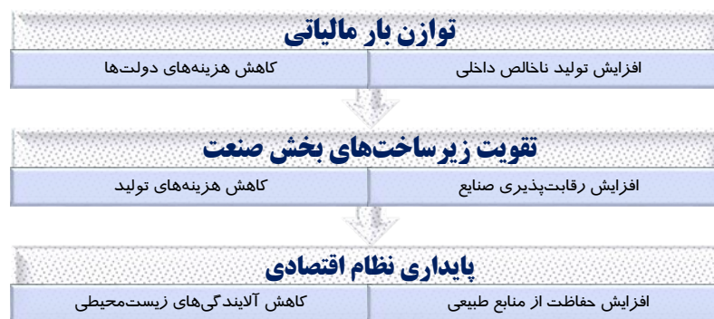
شکل ۲. کارکردهای حسابداری نسلی

می‌نماید، تاچه اندازه کارکردهای توسعه محور شرکت‌ها توانسته به پایداری بیشتر بازار سرمایه منجر شود (عرفی‌زاده و همکاران ۱ ، ۲۰۲۳: ۱۰۱). برای دستیابی به دو مبنای مطلوبیت و هزینه در حسابداری نسلی، شرکت‌ها می‌بایست براساس شیوه گزارشگری صادقانه و منصفانه، نسبت به اهداف و چشم‌اندازهای آینده بازار سرمایه متعهدانه عمل نمایند تا پایداری بیشتری جهت دستیابی به اهداف دولت در نظام اقتصادی حادث گردد (هافمیستر ۲ ، ۲۰۱۱: ۳). از طرف دیگر، دی‌گروت ۳ (۲۰۱۴) حسابداری نسلی را به عنوان یک فرآیند اثربخش در توسعه‌ی پایدار نظام اقتصادی تلقی می‌نماید و در قالب شکل (۲) نسبت به بیان کارکردهای آن اقدام می‌نماید.