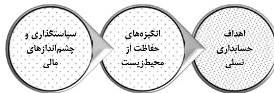
شکل ۳. اهداف حسابداری نسلی (منبع: فرناندز-روکا و همکاران، ۲۰۱۸)

بوچر و استیبنگ ۱ ، ۲۰۱۹: ۱۴۱۱). در لایه دوم، حسابداری نسلی، به دلیل اینکه صنایع را به لحاظ بار مالیاتی تحت تأثیر قرار می‌دهد، شرکت‌ها طبق جهت‌گیری‌های استراتژیک به سمت سرمایه‌گذاری در زیرساخت‌های تولید هدایت می‌نماید تا از این طریق ضمن کاهش هزینه‌های تولید مثل هزینه‌های سربار و استهلاک ماشین‌آلات، امکان رقابتی‌تر شدن صنایع را نیز در بازار سرمایه ممکن می‌سازد. در نهایت در لایه سوم، پایداری نظام اقتصادی محمل‌ترین چشم‌اندازی است که می‌تواند ضمن کاهش آلاینده‌های زیست‌محیطی به افزایش حفاظت از منابع طبیعی برای آیندگان کمک نماید و سر مقصد هدف حسابداری نسلی را در یک سیکل رفت و برگشتی به وجود بیاورد (مقدسی و همکاران، ۲۰۱۴: ۴). فرناندز-روکا و همکاران ۲ (۲۰۱۸) اهداف اصلی حسابداری نسلی را به دو مکانیزم سیاست‌گذاری و چشم‌اندازهای مالی توسعه و تقویت انگیزه‌های حفاظت از محیط‌زیست تفکیک نمودند.