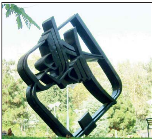
شکل ۳- بسم‌الله، فلز، تهران (نگارنده).

در میانه بالایی مجسمه -که محل انباشت فرم‌هاست- اتصالات میان حروف با کم‌ترین فاصله چیده شده‌اند. چنین تمهیدی تمرکز بصری و سنگینی آن منطقه را بیش‌تر کرده است. ریتم متناوب فرم‌های کشیده و فرم‌های منحنی نیز به جلب توجه منطقه فعال بصری کمک کرده است. از طرفی کادر نقطه نیز باعث گردش و هدایت چشم به این ناحیه می‌شود. خطوط و فرم‌های نرم همراه با کشیدگی‌های سریع و آزاد در برخی نقاط، یادآور نظمی طبیعی است که بسیار چشم‌آشناست. این تنوع فرمیک و ریتم حرکتی را در شاخ و برگ درختانی که در پس‌زمینه این مجسمه حضور دارند نیز می‌توان مشاهده کرد. گویی همان نظم گیاهی است که در قالبی جدید، با مضمونی آشنا، شکل گرفته است.