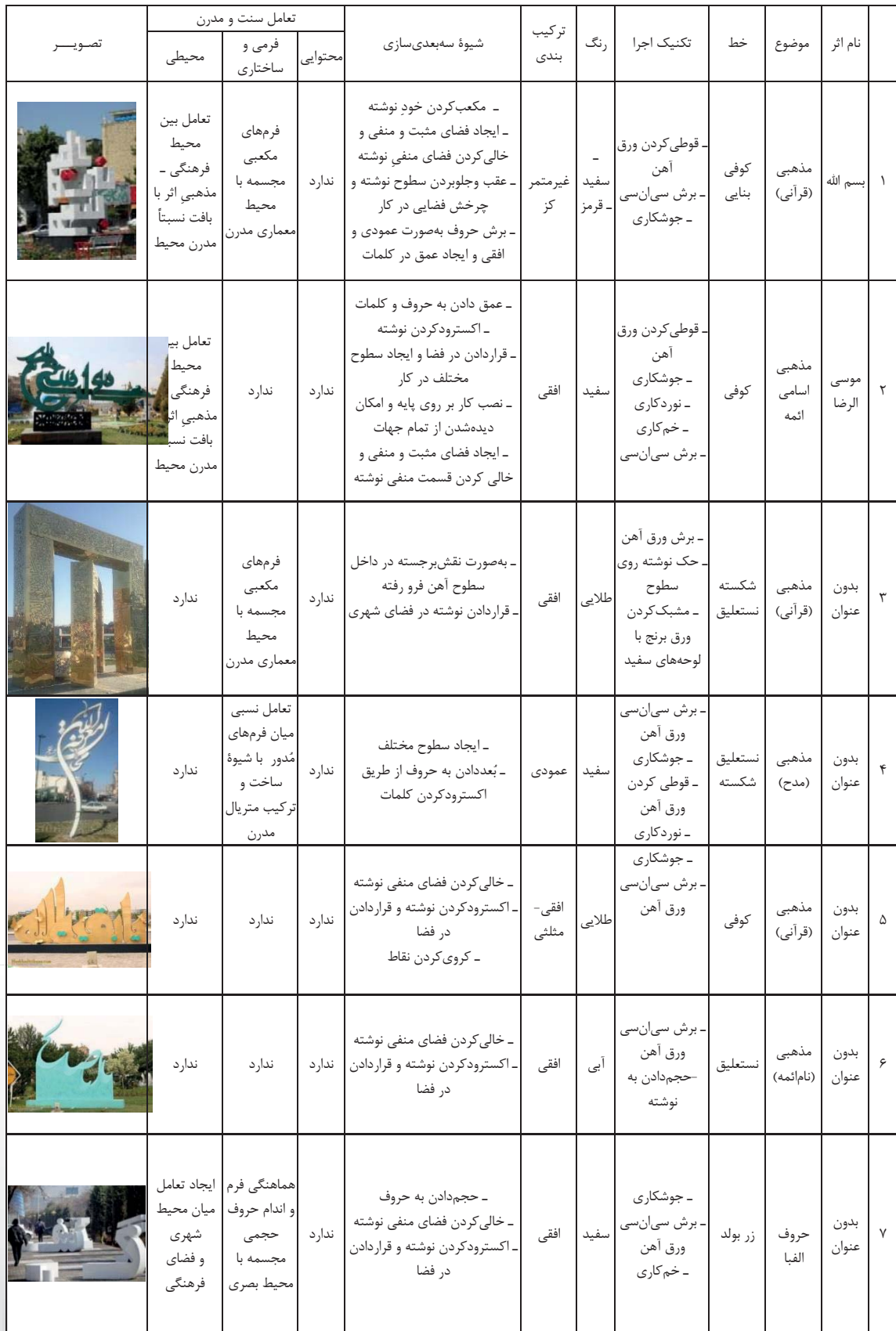
جدول ۱. آثار تایپوگرافی (نوشتاری) اجرا شده در فاصله سال‌های ۱۳۹۰-۱۳۹۴ در شهر مشهد (نگارنده).