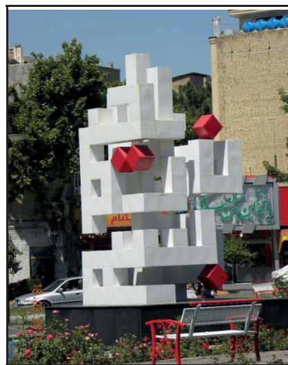
شکل ۲- بسم‌الله الرحمن الرحیم، فلز، مشهد (نگارنده).

تلاش شده تا با قرارگیری مجسمه بر روی سکو و پایه مستقل و با فاصله مناسب ایمنی اثر نیز مدنظر قرار گرفته شود. تنوع ریتم فرم‌ها همراه با تنوع فضاهای مثبت و منفی و نیز تنوع نور و سایه‌ها در اثر، آن را در نهایت، به اثری پویا در چشم مخاطب بدل کرده است. گردش چشم در ترکیب‌بندی اثر، به گونه‌ای طراحی شده که علاوه بر این‌که کلیت مجسمه یک‌جا دیده و درک می‌شود، اجزا و احجام به‌صورت منفرد و غیرپیوسته نیز می‌توانند خوانده شوند. درک دیداری هر اثر چند بُعدی، می‌تواند به‌صورت مشاهده پلکانی و یا ادراک بصری چندمرحله‌ای تحلیل و پردازش شود. از محاسن چنین امری جذابیت و کنج‌کاوی مخاطبان برای شناسایی و تعامل با اثر هنری است.