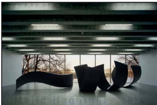
شکل ۴- بسمه، فر، تهران (نگارنده).

ریتم پویا و امکان تغییر فضاهای منفی بین حرکات حروف به واسطه تغییر موضع مخاطب از دیگر ویژگی‌های این تایپوگرافی حجمی است. مرکز ثقل و نقطه عطف این اثر در مرکز ترکیب‌بندی قرار دارد. جایی که سومین ورق تاب‌خورده قرار دارد و سپس، فرم کشیده «سمه» آغاز می‌شود. از آن‌جاکه، این مجسمه در فضایی داخلی کار شده، احتمالاً، مخاطبین خاصی هم دارد که شیوه تعامل آن با مخاطب را نسبت به فضاهای شهری متفاوت ساخته است. بدیهی است چنان‌چه این مجسمه در فضایی غیر از فضای داخلی نصب می‌شد، بسیاری از ویژگی‌های ساختاری و ذاتی خود را از دست می‌داد. در نتیجه، از موفقیت‌های اثر، باید به تناسب و هماهنگی آن با محیط اشاره کرد. ولی چنان‌چه این اثر بخواهد در فضای شهری و فضاهای عمومی نصب و اکران شود، لازم است به موارد ایمنی آن توجه شود.