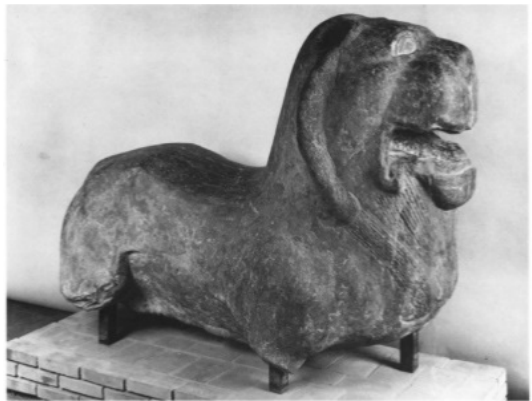
تصویر ۲۶: شیرسنگی، هان شرقی موزه گویمت در پاریس.