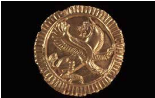
تصویر ۱۵: تزیین لباس طلایی با نقش برجسته شیر، گنجینه جیحون، هخامنشیان قرن ۴ یا ۵ قبل از میلاد یافته شده در تاجیکستان تخت قباد در نزدیکی رود جیحون، اندازه قطر ۴٫۷۵ سانتی متر موزه بریتانیا.