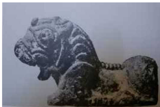
تصویر ۶: شیر مفرغی ریختگی، شمال غرب ایران، هزاره دوم ق. م. طول ۱۷ سانتی متر (همان: ۳۱).

خدایان و بادها می شود، علامت سرعت و تند می باشد و ممکن است که حکایت از گذر سریع عمر داشته باشد. حیوانات بال دار نیز نتیجه اختلاط ویژگی های خدایان مختلف است (هال، ۱۳۸۰: ۳۶۰). بال ها در حال تصعید به نشانه آزادی و پیروزی قرار دارند. بال ها به قهرمانانی وصل می شوند که غول ها، حیوانات فریب کار، سبع (جانور درنده) یا نفرت انگیز را می کشند (شوالیه و گبریان، ۱۳۷۸: ۶۰).