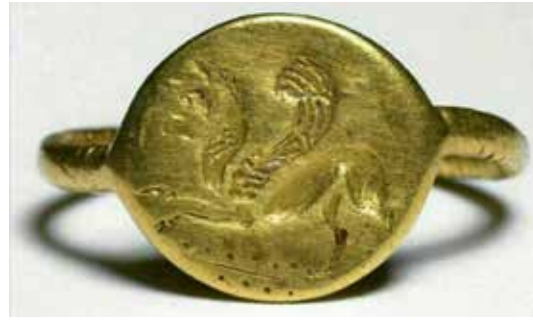
تصویر ۱۲: حلقه انگشتر از جنس طلا با نقش شیربال دار مربوط به گنجینه آمودریا قرن ۵ قبل از میلاد، موزه بریتانیا.