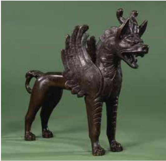
تصویر ۲۱: کوشان، پارتیان، قرن اول تا دوم میلادی یافته شده در افغانستان رود هیرمند اندازه ۲۴٫۹ سانتی متر ارتفاع ۳۲ سانتی متر طول ۱۲٫۵ سانتی متر ضخامت موزه بریتانیا.

نقش برجسته، شامل دو موجود فوق العاده با بدن گربه سانان، گوش های بلند، بال و یال پَرمانند است که ترکیبی از حیوان و عناصر پرنده است و نمونه ای از شیرهای گریفین خاور نزدیک هستند. تقارن مطلق ترکیب بندی، ساده سازی فرم های گیاهی و موتیف شیر گریفین از ویژگی های هنر خاور نزدیک است. این نقش در بسیاری از اشیای یافته شده متعلق به دوره اشکانیان دیده شده است (تصویر ۲۰).