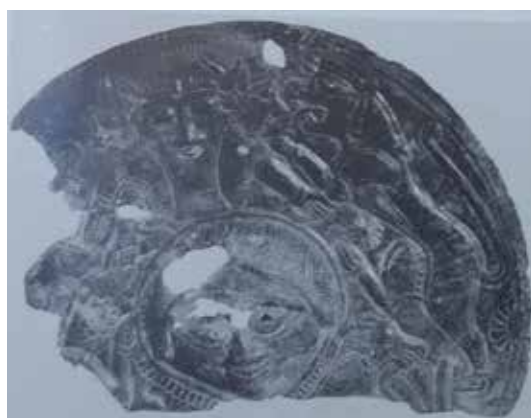
تصویر ۵: قطعه ای از صفحه مفرغی کنده کاری، لرستان، سرخ دم، ۸۰۰ ق. م. ۱۵۰۰ سانتی متر.