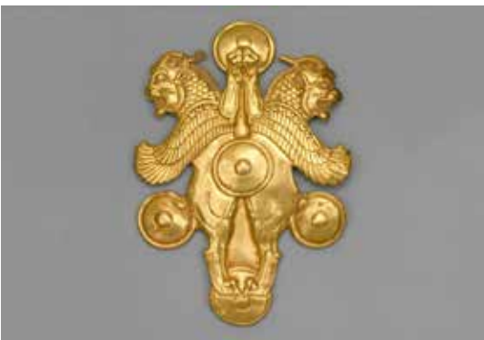
تصویر ۱۷: پلاک طلا با نقش شیر گریفین شاخ دار هخامنشیان قرن ۴ یا ۵ قبل از میلاد، اندازه ۱۳٫۶*۹٫۸ سانتی مت، موزه متروپلیتن.

بخش، جامی قیف مانند و بدنه شیربال دار تشکیل شده است (تصویر ۱۳). جام با شیرهای افقی و گل لوتوس و نخل و پیچکی تزیین شده که در جلوی بدنه به یک شیربال دار متصل می شوند. شیر به صورت نشسته با دست های به جلو و بال های شیرداری در دو طرف ساخته شده است. دهن شیر، باز و دندان ها و زبان او قابل مشاهده است. پنجه های شیر به سمت جلو قرار دارد. بال ها توخالی و از دو ورقه زرین به هم لحیم شده، ساخته شده اند؛ بال ها دارای دو ردیف پرهای ریز ظریف و سه ردیف پرهای بلند هلالی هستند. در دهان باز شده شیر، زبان نصب شده و در پشت آن سوراخ آب ریز وجود دارد که دیده نمی شود. «این حیوان بنا بر سنت های قدیمی مجسم گردیده است. چین گونه و بینی و گوش های گرد با زینتی شبیه به دندان ها گردن و سینه با