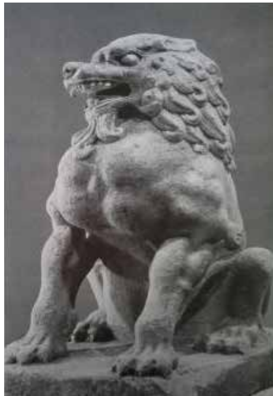
تصویر ۳۸: شیر پاسدار بازمانده از دودمان سوی یا اوایل دوره تانگ در ۶۰۰ میلادی، موزه هنرهای کلیولند اوهایو.

نقش شیر در باورها، اعتقادات و اسطوره‌ها ریشه دارد و در قرون متمادی و براساس پیشینه تاریخی در هنر ایران تکرار شده است. شیربال دار از انگاره‌های مهم در اندیشه و هنر خاور باستان به حساب می‌آید. از آن جا که این سرزمین‌ها، زیستگاه این حیوان اسطوره‌ای بوده با زندگی و هنر مردمانش عجین شده و به یکی از مفاهیم اسطوره‌ای بدل گشته است. این نقش در قرون متمادی و براساس پیشینه‌ای تاریخی در هنر ایران تکرار شده است. یکی از مفاهیم اصلی شیربال دار نگهبانی از مقابر و معابد و دور کردن نیروهای شر و ارواح از این اماکن است. استفاده از پیکره‌ها و نقش برجسته این نماد برای بهره‌گیری از نیرو و قدرت شیراز دوره عیلام رواج داشته و در تمدن‌های بین‌النهرین و ایران نیز گسترش یافته است. برقراری ارتباط میان ایران و چین از قرن دوم قبل از میلاد و اهدا این جانور به درباران در چین توسط اشکانیان زمینه ورود این نماد را به هنر این تمدن گشود. یکی از مهم‌ترین کاربردهای این نقش در هنر