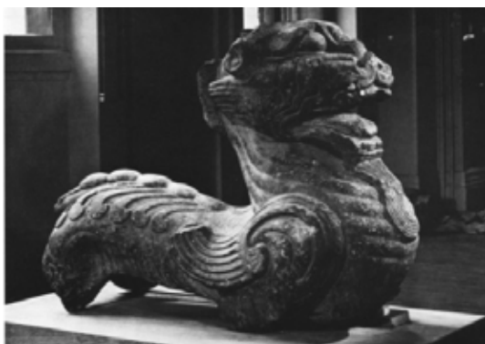
تصویر ۳۲: چیمرای سنگی، هان شرقی، موزه گویمت پاریس (ماخذ: Till, 2014: 274).