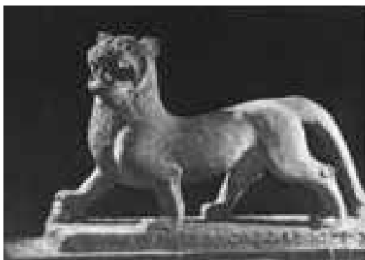
تصویر ۲۹: شیر سنگی، هان شرقی موزه ایالتی شانسی، شیان (ماخذ: Till, 2014: 270).

به بررسی پیکره‌های چیمرا در هنر چین باستان پرداخته می‌شود. شیرهای بال‌داری که آنها را چیمرامی نامند در دوره هان شرقی برای مجسم کردن قدرت ماندگار در مجسمه‌های مقابر آن دوران به عنوان موضوعی متداول رواج داشته. چیمراها چیزی میان شیرواژدها هستند. بنابراین، وابستگی نزدیکی با شیرهای سنگی ذکر شده دارند. «چیمراهای هان