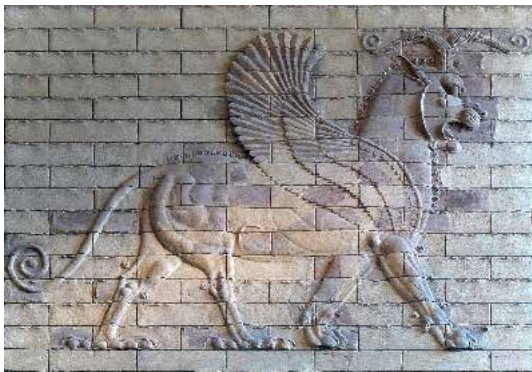
تصویر ۱: شوش شیرافسانه‌ای (قرن ۵ ق. م.) موزه لوور (ماخذ: گیرشمن، ۱۳۴۶: ۱۴۲).