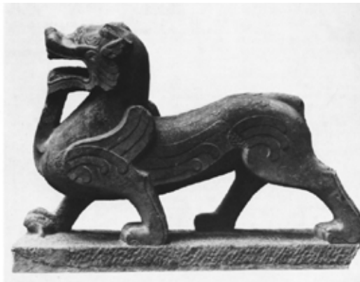
تصویر ۳۵: سرچیمرای سنگی، هان شرقی، گالری نلسون موزه آنتکین، کانزاس سیتی (ماخذ: ibid).