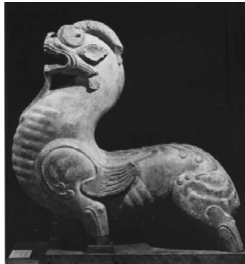
تصویر ۳۳: چیمرای سنگی، هان شرقی، گالری هنرآبرایت کنوکس.