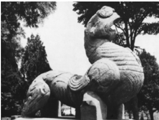
تصویر ۳: چیمرای سنگی، هان شرقی، مقبره تسونگ تزو، ۱۶۷ م. نانیانگ، هونان.