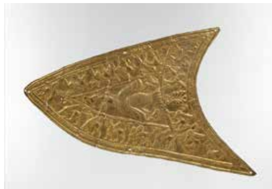
تصویر ۸: پلاک زرین با نقش پرند شکاری و حیوانات بال‌دار، عصر آهن ۳، قرن ۷ یا ۸ پیش از میلاد، اندازه ۱۳*۲۲٫۵ سانتی‌متر، یافته شده در زیویه شمال غرب ایران، موزه متروپولیتن.