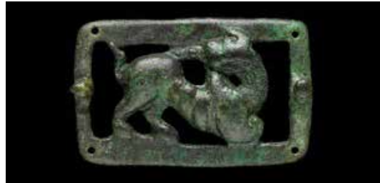
تصویر ۱۸: سگک کمر بند مسی با نقش شیر بال دار، هخامنشیان قرن ۴ یا ۵ قبل از میلاد، اندازه ۶٫۳۵*۴ سانتی متر، موزه بریتانیا.

قطعاً می توان گفت که هیچ نشانه ای از بومی بودن شیر در متون اولیه چین، اکتشافات باستانشناسی دوره چین ۷ پیشین و نقوش اولیه چین یافت نشده است. از آنجا که شیرهای آسیایی یال هایی کوتاه تر از شیرهای آفریقایی دارند، تشخیص آنها از دیگر گربه سانان در نقوش به جامانده سخت است. برخلاف پلنگ - که شواهد وجود آن در تمام مناطق باستان شناسی، تاریخ هنر و کتیبه های به جامانده در چین وجود دارد - شیر به جز در منطقه ای کوچک در شمال هند وجود نداشته است (Behr, 2004: 5).