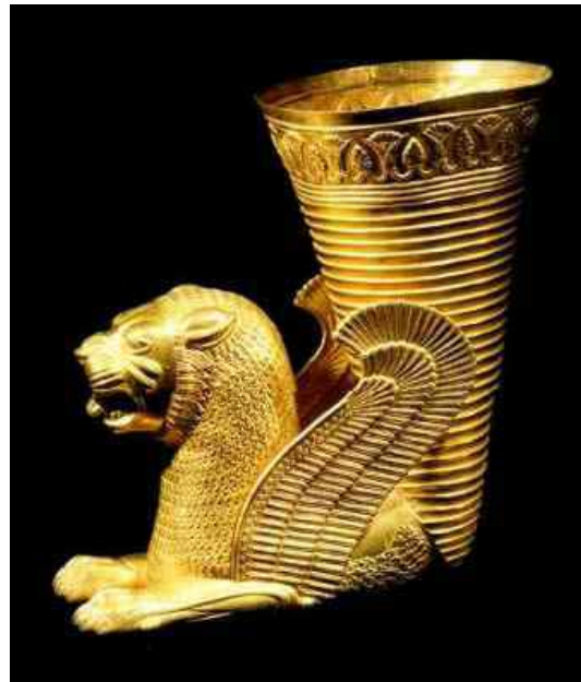
تصویر ۱۳: جام طلای عهد هخامنشی مکشوفه از همدان، ارتفاع ۲۹/۹ و عرض ۱۹ سانتی متر، وزن ۱۹۳ گرم موزه ایران باستان (ماخذ: گبرشمن، ۱۳۴۶: ۲۴۲).