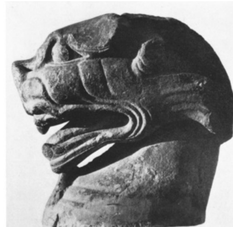
تصویر ۳۴: سرچیمرای سنگی، هان شرقی، موزه رایتبرگ زوریخ (ماخذ: Till, 2014: 275).