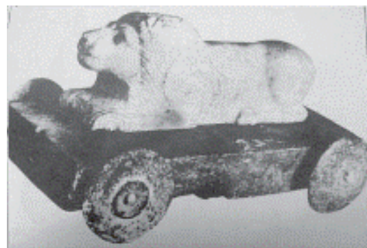
تصویر ۲: پیکره شیر کوچک سنگی در مجاورت معبد اینشوشیناک ارگ شوش (ماخذ: مجیدزاده، ۱۳۷۰: ۶۸).

خیابانی که از سمت شمال شهر بابل به دروازه ایشتار منتهی می‌شود، مردم آن را «آی-ایبور-شبو» به معنای «باشد که دشمن از آن نگذرد» می‌نامند. دو طرف آن، شصت شیرقوی هیکل که مظهر ایشتار بودند- با بال‌های سرخ و زرد بر کاشی آبی نقش شده است (رو، ۱۳۶۹: ۳۳۵). از دوره سوکل مه در قرن ۱۷ قبل از میلاد، معبدی کشف شد که در آن، مجسمه‌های شیرهای خشتی یافت شد که به نماد نگهبان دروازه معبد و شبیه نمونه‌هایی بودند که به عنوان نگهبان ورودی معبد شهر کوچک شادوپوم در تل