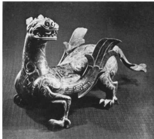
تصویر ۲۳: جانور بال دار از جنس جید، موزه ملی قصر، تایپه، تایوان، دوره هان (ماخذ: ibid).