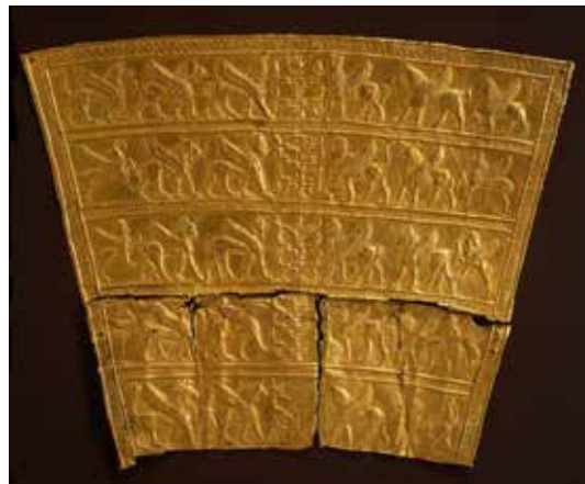
تصویر ۷: لوحه زرین با نقش حیوانات بال‌دار در حال نزدیک شدن به درخت نمادین، عصر آهن ۳، قرن ۷ یا ۸ پیش از میلاد، اندازه ۱۱٫۶۱*۸٫۵۱*۹٫۶ سانتی‌متر، یافته شده در زیویه شمال غرب ایران، موزه متروپولیتن (ماخذ: URL4).