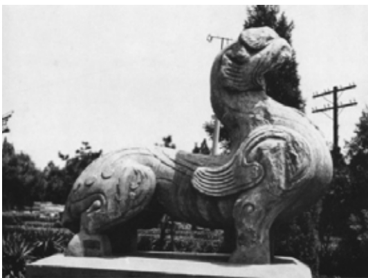
تصویر ۳۱: چیمرای سنگی، هان شرقی، نانیانگ، هونان.