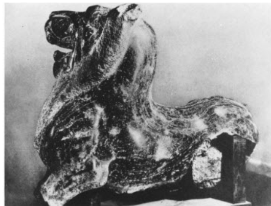
تصویر ۲۷: شیر سنگی، هان شرقی موزه گویمت در پاریس (ماخذ: Till, 2014: 269).