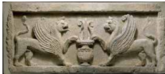
تصویر ۱۹: لوح سنگی، سردر ورودی، با نقش دو شیرو گلدانی حاوی برگ گل نیلوفر در میان، هنر اشکانی، حدود قرن دوم پیش از میلاد تا قرن دوم پس از میلاد، موزه متروپلیتن.