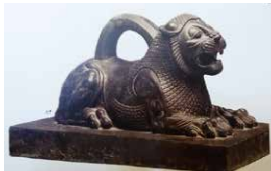
تصویر ۴: وزنه مفرغی. وزن ۱۲۱ کیلوگرم، طول ۶۳ سانتی متر، ارتفاع ۳۰ سانتی متر.

یکی از تصاویر مربوط به شیربال دار در ایران، نقش شیر