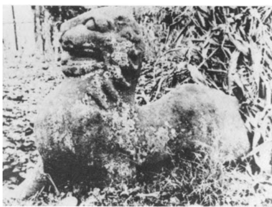
تصویر ۲۸: شیر سنگی، هان شرقی ایالت لوشان در منطقه سیچوان.