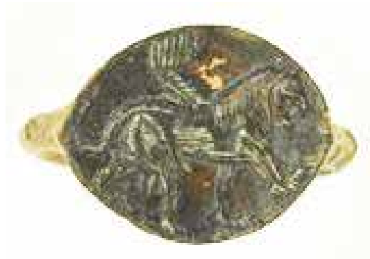
تصویر ۲۰: انگشتر، پارتیان خاور میانه اندازه طول ۱۴ میلی متر عرض ۲۴ میلی متر انگشتر برنزی با نقش شیر بال دار موزه بریتانیا.

زینتی مانند فلس ماهی، یال با قطعات مثلث شکل و نوک برگشته که تا ابتدای کمر حیوان ادامه می یابد» (گیرشمن، ۱۳۴۶: ۲۵۲).