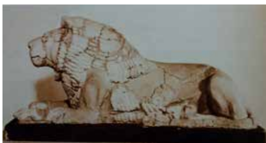
تصویر ۳: مجسمه شیرمینا کاری شده معبد کومپوم کیدویا قرن ۱۲ قبل از میلاد، طول ۱٫۳۶ متر (ماخذ: آمیه، ۱۳۸۹: ۶۴).

بال بر روی بدن انسان یا حیوان، علامت ایزدی و نماد قدرت محافظت است. بال نیز هنگامی که مربوط به پیام آوران،