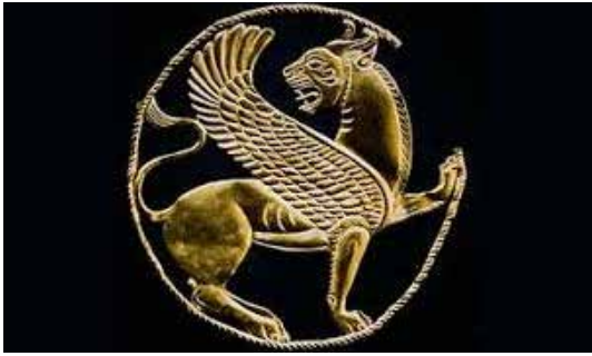
تصویر ۱۴: تزیین طلایی روی پارچه به شکل شیربال دار و شاخ دار احتمالاً از همدان (اکیاتان) قرن ۴ ق. م. موزه موسسه شرقی شیکاگو (ماخذ: پرادا، ۱۳۸۳: ۲۴۸).