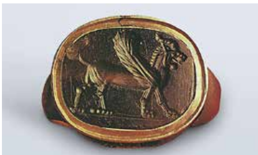
تصویر ۱۱: انگشتر از جنس عقیق با نقش شیر بال‌دار، قرن ۴ یا ۵ قبل از میلاد، اندازه ۱٫۴*۱٫۸ سانتی‌متر، موزه آرمیتاژ (ماخذ: URL2).