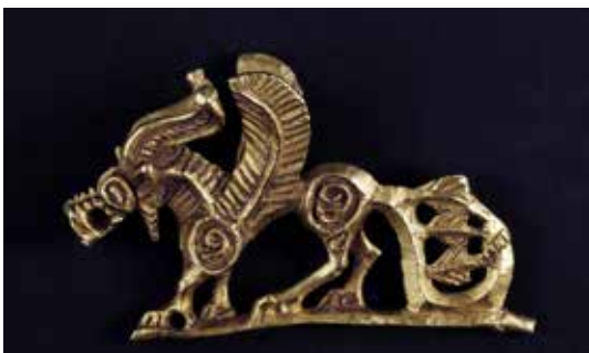
تصویر ۱۶: گریفین ایران قرن ۴ قبل از میلاد یافته شده در سیبری ارتفاع ۵٫۲ سانتی متر موزه ارمیتاژ (ماخذ: URL2).