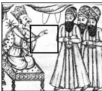
تصویر ۱۷: بر تخت نشستن شیطان به‌جای حضرت سلیمان

شیطان دو انگشت میانی دستش را بسته و دو انگشت دیگر شبیه شاخ دارد و در نوعی دیگر با دست‌های متعدد نشان داده شده است. به‌طور کلی شاخ در دوران باستان و فرهنگ‌های مختلف، مظهر قدرت بوده و کلاه سر خدایگان محسوب می‌شد. در هنر یونانی‌رومی پان‌ها ۱ و گاهی دیونوسوس ۲ (به‌صورت گاو نر) را با شاخ نشان می‌دادند. در دوران باستان مراسم این اسطوره همراه با می‌گساری و انجام اعمال شورانگیز بوده چنان‌که «پان‌ها مظهر گناه و نیروی شهوت محسوب می‌شدند. در هنر مسیحی نیز شاخ‌های شیطان یکی از هفت گناه را شامل می‌شد» (هال، ۱۳۹۸) البته اگر این کار با دست چپ انجام می‌گرفت معنای نفرین به شمار می‌آمد.