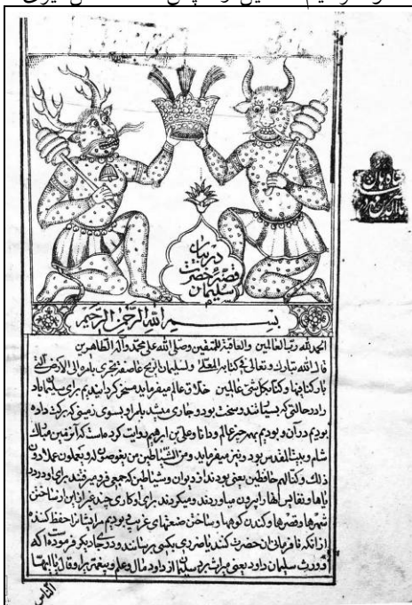
تصویر ۱: صفحه شروع کتاب در بیان قصه حضرت سلیمان، ۱۲۶۶ق

ماوراءالطبیعه گزینش شده‌اند. زیرا هدف آن است تا با بررسی لایه‌های معنایی و ارزش‌های نمادین مستتر در وجود بصری هر یک از این موجودات به مثابه نشانه‌هایی در کل ساختار نگاره‌های کتاب مذکور، نحوه ترسیم، تحلیل و سپس منشأ شکل‌گیری‌شان تبیین شود.