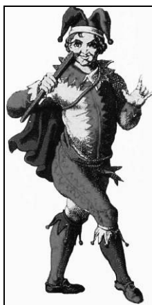
تصویر ۲۸: دلک نشان خرد کودکانه. (بروس میت فورد، ۱۳۸۸: ۱۱۵)