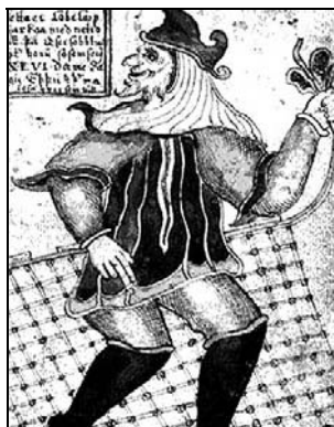
تصویر ۲۷: لوکی مصورشده در کتب قرن هجدهم میلادی. (گرکنی و عبدلی، ۱۳۹۲: ۲۷۰)

خود را فرزندان لوکی می‌دانستند» (همان). در کتاب مدنظر نیز، شیطان بسیار شبیه به اسطوره لوکی (دلک) ترسیم شده است که سمبل خرد کودکانه نیز به خود گرفته است و با چهره مضحک با بینی خمیده به حالت نیم‌رخ و ریش روی چانه همانند تصاویر ۱۸ و ۲۰ کلاهی نوک‌تیز و بلند با گوشه‌های برگشته، چکمه‌ای تا زانو، با نوک خمیده و تزئینات دور کلاه تصویر شده است.