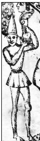
تصویر ۲۶: قسمتی از تصویر ۱۱، تجسم یک دیو در شمال بل شیطانی، نشان خدای فاقد اصول اخلاقی.