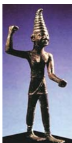
تصویر ۲۵: بعل، ۱۲۰۰ ق.م، سوریه یا ترکیه.

در کتاب تاریخ جادوگری آمده است که «در عصر آشوریان و بابلیان، بتی به نام بعل فه‌گور ۱ پرستش می‌شد. خدایی که پنداشته می‌شد در گودال‌ها و لای صخره‌ها به سر می‌برد، قربانی می‌کند و اصول اخلاقی در او راه ندارد» (گل سرخی، ۱۳۷۷). نیز همانند «اسطوره‌های مردوخ و آشور در بین‌النهرین، مجری دستورات خدایان است و با نیروهای طبیعت همچون تندر، آذرخش و طوفان پیوند نزدیک دارد» (گری، ۱۳۷۸). مترادف با اسطوره «داجون، داجان (در آیین عبری)، تموز (در بین‌النهرین) و دمتر (در یونان باستان) است که می‌میرد و دیگر بار از مردگان برمی‌خیزد» (همان: ۱۲۰). بعل پیکره‌ای انسانی و مردانه دارد که با دامن کوتاه و اغلب اندامی برهنه، خنجری آویخته و گریزی به دست تصویر می‌شود. در نگاره‌های کتاب در بیان قصه حضرت سلیمان هم به صورت یک جن رام‌شده مشاهده می‌شود، با دامنی کوتاه، تنی برهنه که کلاهی هرمی شکل دارد و نمود موجود پلیدی است که در بارگاه حضرت سلیمان تحت احاطه درآمده است (تصویر ۲۶).