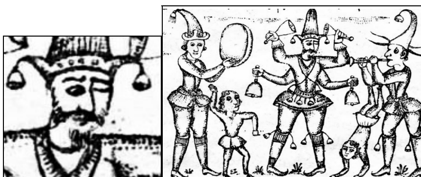
تصویر ۲۰: شیطان نماد شر در میان جنیانی که مطیع سلیمان بودند. (اسناد چاپ سنگی کتابخانه ملی)

شیطان را در وسط صفحه نشان می‌دهد که مقامی بالاتر از سایر شیاطین و جنیان دارد و یک چشم بسته به نشانه تک چشم شیطان (نماد شر و غول‌های مخرب) را نشان می‌دهد. بسته‌بودن یک چشم به‌طور کامل مشخص است؛ به‌خصوص آنکه لباس دلکک بر تن کرده است.