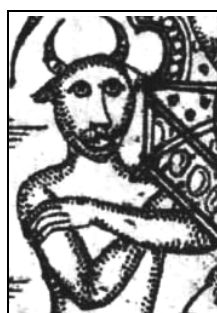
تصویر ۲۳: بخشی از تصویر ۷، قراردادن دست‌ها به‌صورت ایکس بر روی هم به نشانه احضار شیطان و بندگی او، (اسناد چاپ سنگی کتابخانه ملی)

مطابق تصویر ۲۳، حالت قرارگیری دست‌های این عفریته شبیه ضربدر است که در چند نگاره دیگر نیز این شیوه برای اجنه به کار رفته است. دست به سینه بودن پیکره‌های انسانی و سایر موجودات، به شکل دو بازو روی هم قرار می‌گیرد که با طرز قرارگیری این موجودات متفاوت است. این فرم شبیه به حرف ایکس در انگلیسی است. «تعریف از حرف ایکس می‌تواند نمود جن، موجودی با هویت مجهول، باشد» (ghalam.rzb.ir). البته این نماد در هنر مصری از دوران باستان استفاده می‌شد، به شکل دو خط متقاطع (شبیه به حرف X) بوده و در آموزه‌هایشان نماد خضوع، بندگی و پرستش شیطان محسوب می‌شد. «کاهنان مصر باستان همیشه هنگام ادای احترام دستان خود را به صورت ضربدری در مقابل سینه‌شان می‌گرفتند که به‌معنای احضار شیطان و بندگی و پرستش او بود. این نماد همراه با سایر آموزه‌های شیطانی کابالا (سنت شفاهی جادو و جن‌گیری) به‌مرور به کار رفت تا اینکه از سال ۱۶۰۰م. دوباره در اروپا رایج شد» (iqna.ir). «این علامت به‌صورت مخفیانه و به شکل یک نشان ارتباطی سالیان دراز در میان فراماسون‌ها و گروه‌های شیطانی استفاده می‌شد» (erfan.ir). نشان ظهور و احضار شیطان و بندگی اوست. این نماد به‌معنای تجسم شیطان و آماده‌کردن جهان و جهانیان برای بردگی و بندگی اوست.