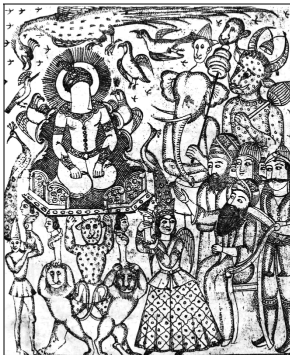
تصویر ۱۲: دیو به شکل فیل، پلنگ، شیر، خرس و گاومیش در بارگاه حضرت سلیمان (ع)

تجسم دیوها در کتاب عجائب المخلوقات اغلب با این توصیفات همراه است که بدنی نیمه‌انسان و حیوان با شاخ و دم، گاهی چهره انسانی و گاهی چهره حیوانی مانند فیل دارند. هیکلی درشت، بدنی پشمالو با ناخن‌های بلند و در هیبتی بزرگ‌تر از انسان نمایان می‌شوند. این تجسم‌ها تبدیل به بخشی از الگوی تصویرسازان شد. انسان‌های شاخدار با سم و پای حیوانی و ایستاده در هنرهای تصویری هزاره‌های پیش از میلاد در لرستان و عیلام مشاهده می‌شوند که نماد پهلوانی داشتند و این دیوان نزد زرتشتیان مقدس بودند، اما به‌مرور مفهوم شر به خود گرفتند و در هنر آشور تبدیل به دسته‌ای از دیوان شر شدند.