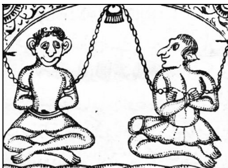
تصویر ۱۶: زنجیر کردن شیاطین در حبس به شکل بوزینه. ( اسناد چاپ سنگی کتابخانه ملی )