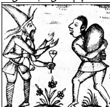
تصویر ۱۸: شیطان با چهار دست نماد نابودی و پیام‌آور مرگ.