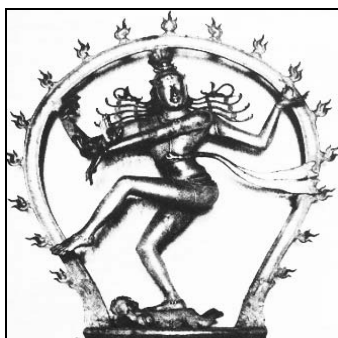
تصویر ۱۹: الهه شیوا، مفرغ رقااص کیهانی، معبد نالتونای ایشوارام، پونجای، ۱۰۰۰ م. (گاردنر، ۱۳۸۵: ۶۹۵)

در تصاویر چاپ سنگی داستان حضرت سلیمان، دست‌های شیاطین هم به صورت شاخدار و هم چهار دست دیده می‌شود. همان‌طور که در تصویر ۱۷ دیده می‌شود شیطان با چهره‌ای لوزی و سه رخ، دست راستش را به سمت درباریان سلیمان که اینک مطیع اویند بلند کرده و «به شیوه‌ای که نشان‌دهنده نماد الهه شاخدار، افسونگری و جادو است» (امین خندقی، ۱۳۸۹) نمایان می‌شود. این معنای نمادین فقط با دست راست انجام می‌شود. در تصاویر ۱۸ و ۲۰ نیز شیطان دارای دست‌های متعددی است. در واقع این نگرش از خدایان بودایی و هندو برگرفته شده است (تصویر ۲۱) که بعدها نزد ایرانیان تبدیل به نیروهای شر شدند. برهما، ویشنو، شیوا، همسر برهما و گانش هر کدام چهار دست دارند. دست‌های متعدد نشئت‌گرفته از قدرت آنها در جهان است مثلاً «برهما وجود آفرینندگی دارد و به‌عنوان رافع موانع مورد تکریم است. اما شیوا که از خدایان ودایی بوده و بیش از سایرین به تصویرسازی‌های این نسخه شبیه است، نابودکننده و پیام‌آور مرگ می‌باشد» (بوکر، ۱۳۸۹)