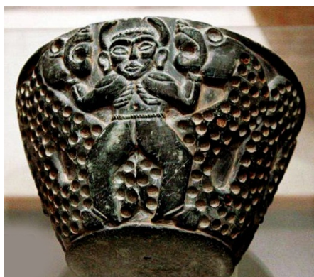
تصویر ۶: نقش اژدها روی ظرفی از جنس صابون، متعلق به تمدن جیرفت هزاره سوم ق.م.

قدیمی‌ترین یافته‌های نقش اژدها مربوط به هنر جیرفت در حدود هزاره سوم قبل از میلاد است که در دو دهه اخیر یافت شده است. با مشاهده تصویر ۶، دو اژدهای خالدار عظیم‌الجثه به صورت مار، روی ظرفی از جنس سنگ صابون نقش بسته‌اند. این دو اژدهای خشمگین که از طریق یک قهرمان شاخدار تحت احاطه درآمده، صحنه گرفت و گیر را ایجاد کرده است، به گونه‌ای که مبارزه نیروهای خیر و شر و دفع اهریمن را همچون یک نمود آیینی (نقش کیهانی) تداعی می‌کند. در دوران اشکانی بال‌های کوچک به اژدها اضافه می‌شود و در دوران ایلخانی که نفوذ هنر چین در طراحی‌ها فزونی می‌یابد مانند اژدهای معبد «داش کسن» در زنجان، نقش اژدها به گونه‌ای جلوه می‌کند که هم‌اکنون در نسخه در بیان قصه حضرت سلیمان مشاهده می‌شود. چینیان معتقدند اژدها آفریننده‌ای نیکوکار است که از تمساحی در رودهای یانگ‌تسه نشئت گرفته و دارای شاخ و دندان‌های دراز، بدنی فلس‌دار و پاهایی چنگالی‌شکل است که روح کیهانی دارد.