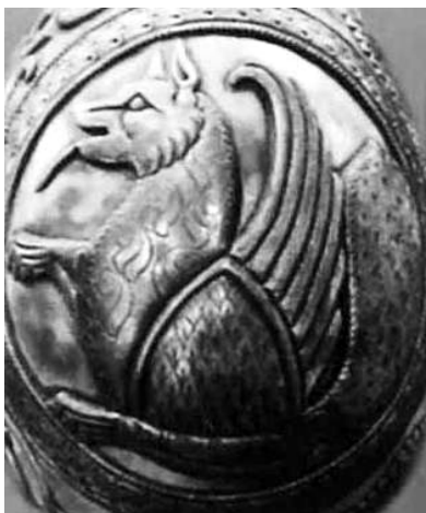
تصویر ۳: سمیرغ ساسانی، نقش برجسته‌ای بر روی یک اثر سیمین (طاهری، ۱۳۹۶: ۳۱۲)

در ترکیبی از دم طاووس، بدن عقاب، سر سگ و پنجه‌های شیر که از سمیرغ افسانه‌ای در هنر ساسانی برگرفته (تصویر ۳)، لیکن با این تفاوت و تغییر اندک که گردن‌بند مرواریدشان بر گردن سمیرغ ساسانی، نماد فره ایزدی، را حذف کرده و برایش منقار ترسیم کرده است.