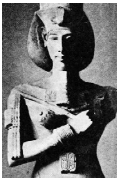
تصویر ۲۴: آخناتون، معبد آتون، ۱۳۷۵ ق.م. (گاردنر، ۱۳۸۵: ۹۴)