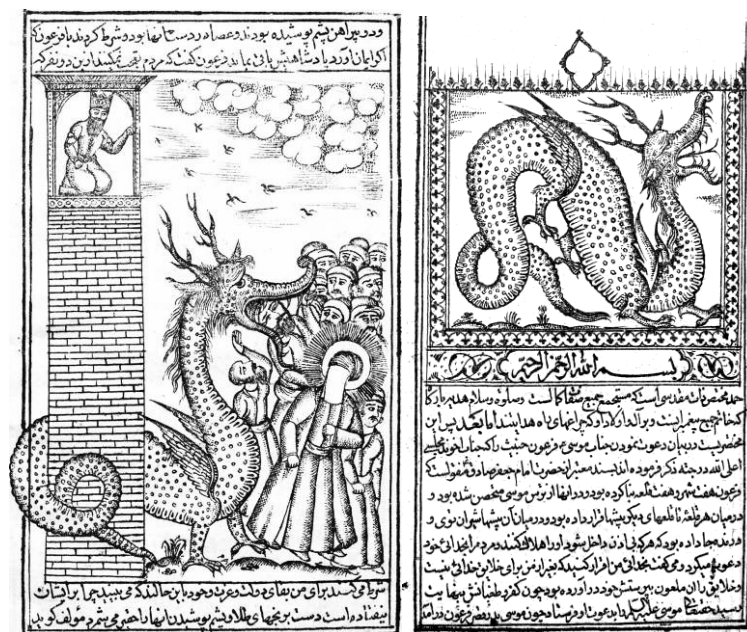
تصاویر ۷ و ۸: اژدها به مثابه نیروی ماوراءالطبیعه و خیر در برابر نیروی شر و دشمن.

گوزن، گوش‌های آویزان، بالی کوچک در قسمت میانی و دهانی همچون تمساح نقش گردیده است. مار پیچده‌ای که با حرکتی سیال، حالت حمله به خود گرفته درحالی‌که در صفحه آغازین در میان کادر مربعی شکل جا داده شده و فرمی حلقوی به خود گرفته است. در تصویر ۸ اژدها به دور ساختمان فرعون پیچیده و او را می‌بلعد. مردم اطراف و ساحران، وحشت زده با سیمایی ترسان نشان داده شده‌اند که هر کدام برای فرار به این سو و آن سو نگاه می‌کنند. فضا سازی صحنه با ابرهای درهم تنیده همراه با خطوط متراکم و ازدحام جمعیت، ملتهب به نظر می‌رسد. در اینجا اژدها حجتی برای ایمان ساحران است که به شکل یک نیروی ماوراءالطبیعه ظاهر شده است.