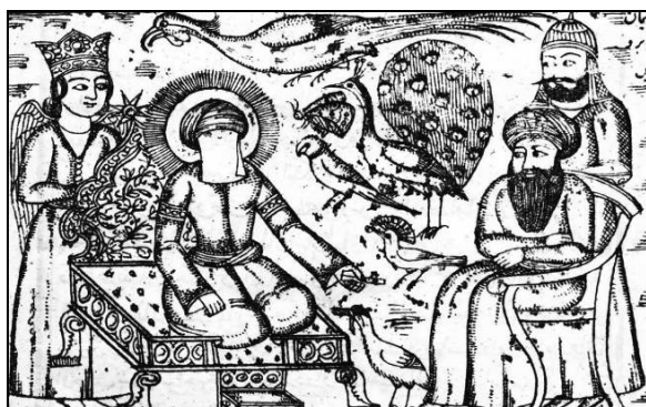
تصویر ۲: نقش سیمرخ به مثابه حامی، نگهبان و پشتیبان بارگاه حضرت سلیمان. (اسناد چاپ سنگی کتابخانه ملی)

از زمان‌های دور، سیمرخ با فضای درباری و بهشتی عجین بوده است. در شاهنامه فردوسی، نجات‌بخش و حامی زال است و موجودی اسطوره‌ای، خردمند، رهاهنده از بیماری و مرگ، آگاه از تقدیر و حوادث آینده به شمار می‌آید. در اوستا نیز حافظ و نگهبان است (قلی‌زاده، ۱۳۹۲: ۱۵۵) و در ادبیات ایرانی اسلامی همچون اشعار عطار ( منطق الطیر ) و آثاری از غزالی، سهروردی و شبستری به مثابه نشانه‌ای از وجود آفتاب، دانسته شده است که همان ذات حق است. بر این اساس، در داستان حضرت سلیمان هم به عنوان حامی و نگهبان ترسیم شده که با داشتن نیروی خیر، سعادت و جاودانگی، پشتیبان دولت سلیمان است و در دربارش خدمت می‌کند. میرزا علی قلی خوبی این موجود را در سه نگاره کتاب با دم بلند و بدنی کشیده در بالاترین قسمت کادر صفحه، در حالت معلق و متمایل به حضرت سلیمان چنان تصویر کرده که گویی بر روی بارگاه حضرت سلیمان سایه گسترانده و نقش نیروی سلطنتی و همای سعادت را ایفا می‌کند (تصویر ۲). حتی برای نشان دادن عظمت این موجود قسمتی از بدنش را خارج از کادر نگاره‌ها مصور ساخته است (تصاویر ۹ و ۱۴).