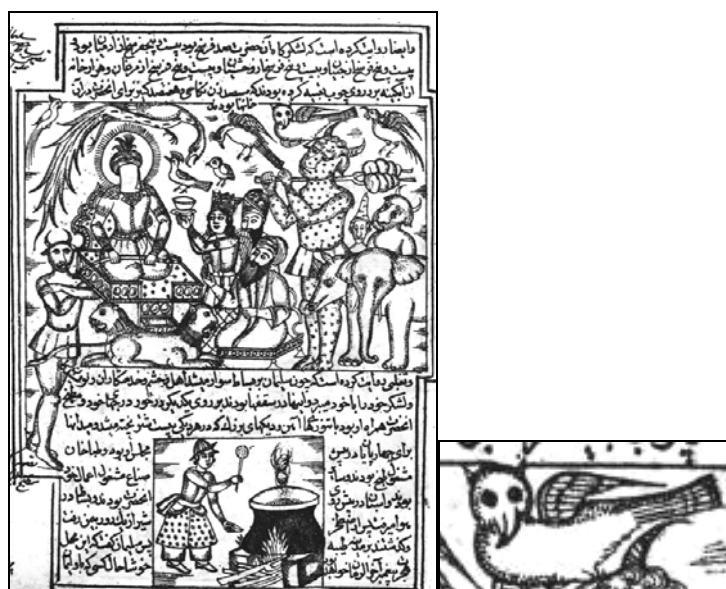
تصویر ۹: پرندهٔ شاخدار اسطورهٔ جن و عفریته و نماد شر در برابر خیر (اسناد چاپ سنگی کتابخانهٔ ملی)

روبه‌رو، چشمانی گرد، منقاری بلند و بدنی سه رخ ترسیم شده تا همچون عفریته‌ای به نظر آید که به شکل پرنده درآمدۀ است. چهره‌ای همچون جغد که با شاخ روی سر، نمود اهریمنی پیدا کرده و در بالای نگاره، نقطهٔ مقابل حضرت سلیمان قرار گرفته تا بیانگر تسخیر شدن به‌واسطهٔ قدرت و فرمان آن حضرت باشد (تصویر ۹).