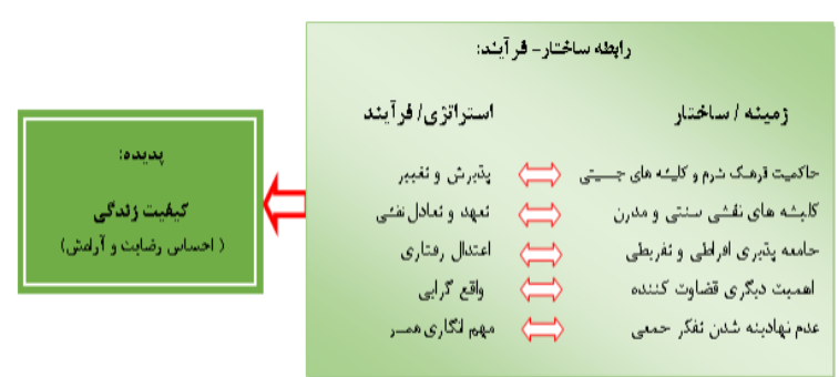
شکل ۱. مدل مفهومی کیفیت

متمرکز ۱ و کسب مقولات عمده انجام شد. این کدگذاری به صورتی است که در هر مرحله، داده‌ها بر حسب شباهت و تفاوت‌هایشان کنار یک‌دیگر قرار می‌گیرند؛ لذا در هر مرحله به سطح انتزاع داده‌ها اضافه و از حجم و تعداد آنها کاسته می‌شود. در مرحله کدگذاری محوری، پدیده اصلی پژوهش یعنی کیفیت زناشویی با توجه به دو محور اصلی یعنی زمینه (ساختار) و استراتژی (فرایند) مورد تحلیل قرار گرفت. مدل مفهومی پژوهش در شکل ۱ به تصویر کشیده شده است که در ادامه جزئیات آن تشریح می‌گردد.