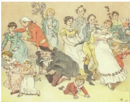
تصویر ۶- صاحب منصب پرمدعا، راندولف کالدکوت ۱۸۷۴.

این خصیصه در کودکان به هنرمند امکان جولان بیش‌تری در تخیل‌پردازی می‌دهد (نودلمن، ۱۳۸۵: ۸۸). طنز از دیگر ویژگی‌های آثار کالدکوت است. در جامعه نوپای صنعتی آن روز که مردم از طبقات اجتماعی پایین به طبقه بالاتر ارتقا یافته بودند، رفتاری تجمل‌مآب رواج داشت. حضور طبقات متوسط اجتماعی در جشن‌ها و کارناوال‌های سالانه یکی از سرگرمی‌های مردمان آن عصر بود. در چنین جشن‌هایی،