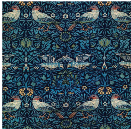
تصویر ۳- کاغذ دیواری، ویلیام موریس.

نیکولاس پوزنر ۱۹ محقق انگلیسی می‌نویسد، انتقال از شرایط قرون وسطایی به وضع مدرن هنرهای کاربردی در حدود اواخر قرن هجدهم به تحقق پیوست. بعد از ۱۷۶۰ یک جهش ناگهانی در بهبود تکنیکی واقع شد. این امر بدون تردید به خاطر تغییرات ژرف فکری که با رفرمیسم ۲۰ (دوره اصلاحات) آغاز و در طول قرن هفدهم قوت یافته و سرانجام در قرن هجدهم حکم فرما گشت. راسیونالیسم ۲۱ (خردگرایی) و علوم تجربی ۲۲ زمینه‌های تعیین‌کننده فعالیت اروپا در عصر خرد می‌باشند. بدین ترتیب، خلاقیت نوخاسته، زمینه عملی جدید یافت. انگلستان نیز به علوم کاربردی پیوست و صنعت به مفهوم خلاقیت طبقه متوسط با کلیسا و اشراف درآمد (پوزنر، ۱۳۶۴: ۳۷). شالوده فکری دیگر در شکل‌گیری بینش دوره ویکتورین، جنبش هنرها و پیشه‌ها ۲۳ است. گروهی از هنرمندان و طراحان در نیمه دوم قرن هجدهم با هدفی مشترک به یک دیگر پیوستند و هدف آن‌ها ارتقای هنرهای زیبا و نهایتاً، اصلاح شرایط اجتماعی بود. ویلیام موریس ۲۴ رهبر این جنبش تحت تأثیر شکوه هنر شرق به