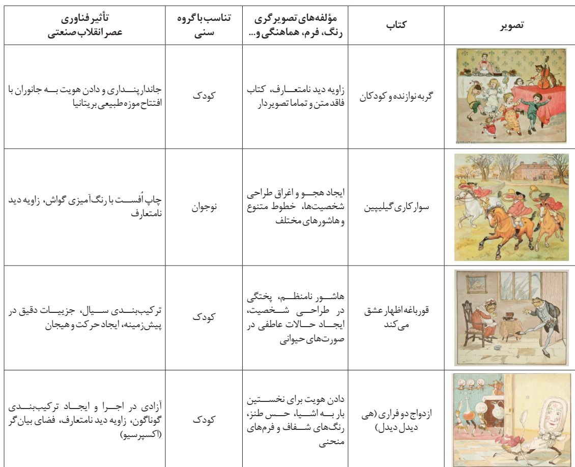
جدول ۲. بررسی تصویرگری های راندولف کالدکوت.

افتتاح موزه تاریخ طبیعی بریتانیا در سال ۱۸۸۱ نقطه عطفی در انگلستان به شمار می رود. وجود انواع گونه های حیوانی، دیرینه شناسی و گیاه شناسی و کشفیات کاوش گران انگلیسی در آفریقا، هندوستان و اقیانوسیه، شناخت گونه های جانوری و گیاهی را به ارمغان آورد. راندولف کالدکوت یکی از هنرمندانی