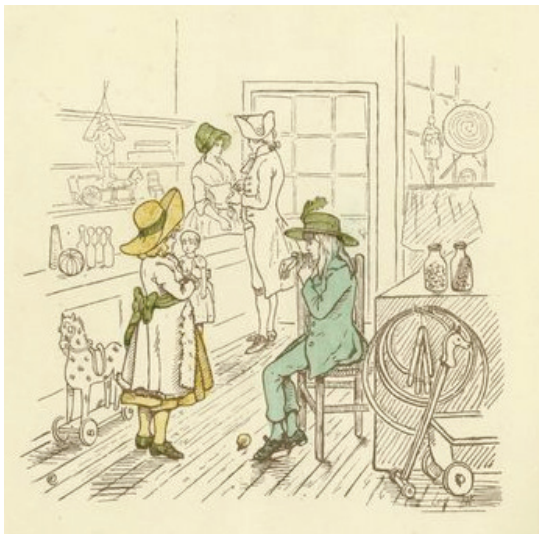
تصویر ۲- بچه‌گریزیا، تصویرگری آکونستر، ۱۸۰۸.

عصر طلایی به دوره‌ای از سال‌های ۱۸۸۰ تا ۱۹۳۰ میلادی گفته می‌شود که برخی از بهترین آثار ادبی و هنری در زمره ادبیات کودک خلق شدند. عصر طلایی نقطه اوج یک جنبش پیش‌روبر اساس تحولات انقلاب صنعتی بود که اولین بار بر متونی مختص به ادبیات کودک اتکا داشت و امروزه به عنوان منبع الهام برای نویسندگان و تصویرگران جوان یاد می‌شود. در طول عصر طلایی