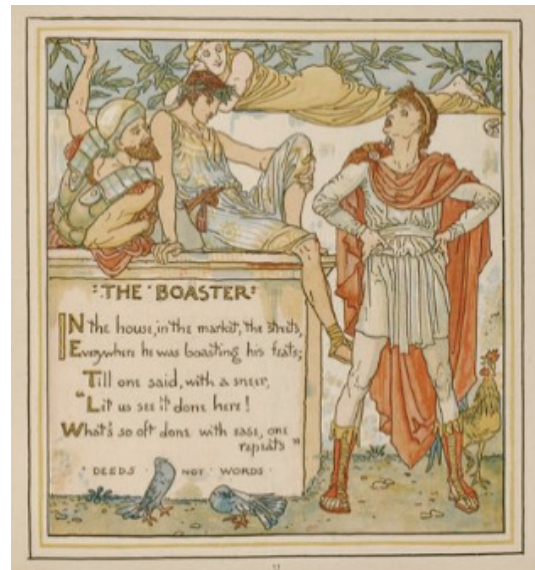
تصویر ۵- داستان‌های ایزوپ، والتر کریین ۱۸۸۷.

وضعیت مرتبط بودن تصاویر کتاب‌های والتر کریین با پیشرفت‌های عسرویکتورین نتایجی را در برداشت که به شرح ذیل است: مستقل بودن شخصیت کاراکترها، نمایش هویت ملی، تناسب فضای منفی و مثبت، استفاده از ریزنقش‌های منشعب از جنبش هنرها و پیشه‌ها و هم چنین، نوع بیکره‌آرایی بر اساس ناتورالیسم رومی. انگلستان، در سال ۱۸۳۲ بخش عمده‌ای از مجسمه‌های نماهای معبد پارتنون را به انگلستان انتقال داد. کشورگشایی‌ها و سیاست استعمارگونه انگلستان در عسرویکتورین و بازگشایی نمایشگاه‌های قصر بلورین، موجبات تأثیرپذیری از فرهنگ‌های بیگانه را باب کرد. والتر کریین در تصویرگری «مردی که با هیچ چیز خشنود نبود»، تحت تأثیر مجسمه‌های باستانی یونان قرار گرفته بود (Dela-ny, 2007: 185). تکنیک به کار رفته در آثار کریین، برداشتی