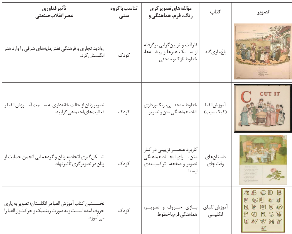
جدول ۳. بررسی تصویرگری‌های کیت‌گربانوی (ماخذ: نگارنده).

بود که به موزه طبیعی می‌رفت و از گونه‌های جانوری طراحی می‌نمود. «کالدکوت طبیعتاً شیفته اشیاء و سکناات جدید بود، سطوح و سایه‌های طبیعی جانوران، حجم بدن متغیر در انواع آنان و نورهای واقعی روی پیکره آن‌ها، کالدکوت جوان را مجذوب ساخته بود. کالدکوت مشتاقانه به ترسیم جانوران می‌پرداخت و به تدریج به آنان هویت می‌داد و در نقاشی‌هایش به جای آدمیان، جانورانی سخن‌گو ترسیم می‌کرد» (Ray, 1991: 239). کالدکوت در بیست سالگی کارمند بانک بود و به طراحی خیلی علاقه داشت و در کلاس‌های شبانه نقاشی، طراحی مقدماتی و حجم‌سازی آموخت. وی آناتومی را با تشریح پرندگان و حیوانات فرا گرفت (مگز، ۱۳۸۸: ۱۹۲). نودلمن معتقد است، کالدکوت با شخصیت دادن به جانوران، تخیل‌پردازی در کتاب کودک راقوت می‌بخشد. بالا بودن قوه تخیل کودک باعث می‌شود که او همه چیز را جاندار ببیند. از نظر او، حیوان و گیاه همان احساسی را دارند که انسان. خورشید همه چیز را می‌بیند، ابر می‌گریزد و حیوان با درختان صحبت می‌کند.