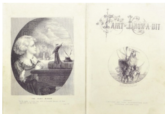
تصویر ۴- پری اندکی می‌داند، آی ال او، لندن ۱۸۴۶ (ماخذ: URL7).

کرین لحنی جدی و بزرگ‌سالانه داشت و عمده تصویرگری‌هایش متناسب با گروه سنی بزرگ‌سال بودند. تمایل به سبک ناتورالیسم و شباهت به الگوهای باستانی روم و ترکیب‌بندی‌های مستطیل‌وار و از چند زاویه دید عناصر نشان از علاقه وی به سنت‌های کهن تصویرگری دارد که با فناوری انقلاب صنعتی همگام شده است (تصویر ۵). کرین علاقه بسیاری به متون کلاسیک داشت و از تصویرگری کتاب‌های درسی و آموزشی سر باز می‌زد. به نظر می‌رسد که گرایش وی به تصویرگری بر اساس فرم‌های تزئینی و پیکره‌های محزون و ترکیب‌بندی‌های راست‌فایم، مانع از فعالیت وی در حوزه تصویرگری کتاب‌های شعر و الفبامی شده است.