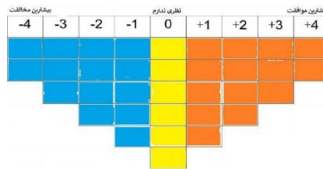
شکل ۱- جدول ۳۴ عاملی کیو